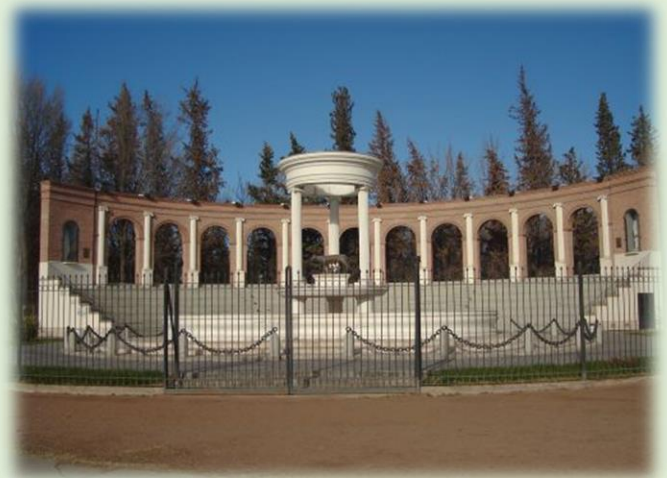
Monumento al Inmigrante