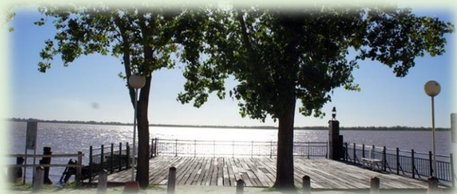
Puerto de Villa Urquiza

Parroquia de la Inmaculada Concepción Av. Alameda de la Bajada s/n (0343) 487 2073