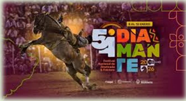
Festival Nacional de Jineteada y Folclore