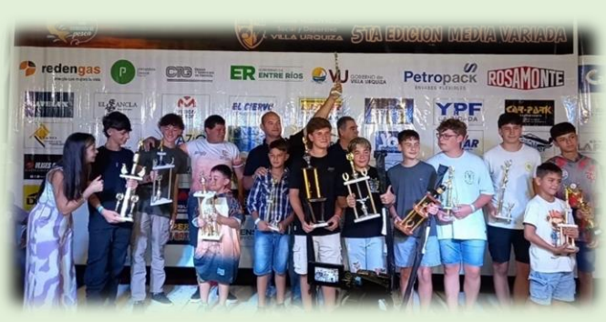
Torneos zonales de Pesca de Costa