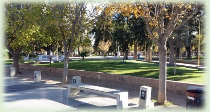
Plaza General San Martín