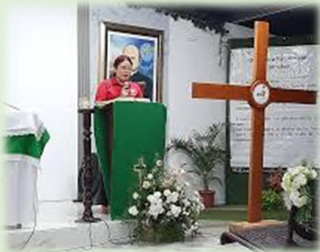
Capilla San Arnoldo Jansen Costa Grande