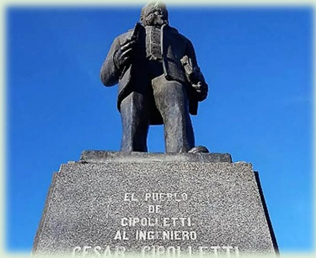
Monumento al Ing. Cipolletti