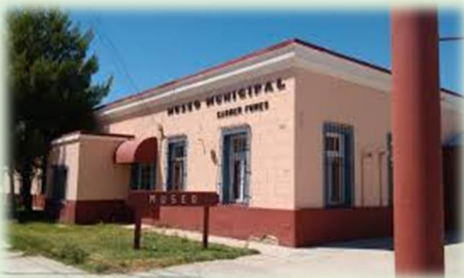
Museo de Ciencias Naturales