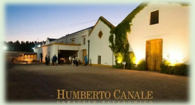
Bodega Humberto Canale