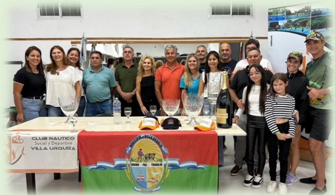
Fiesta del Pescador Deportivo