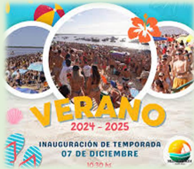
Inauguración de la Playa