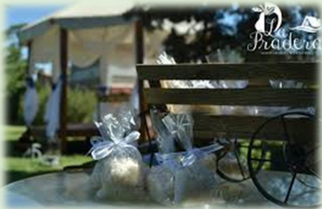
La Pradera Agroturismo