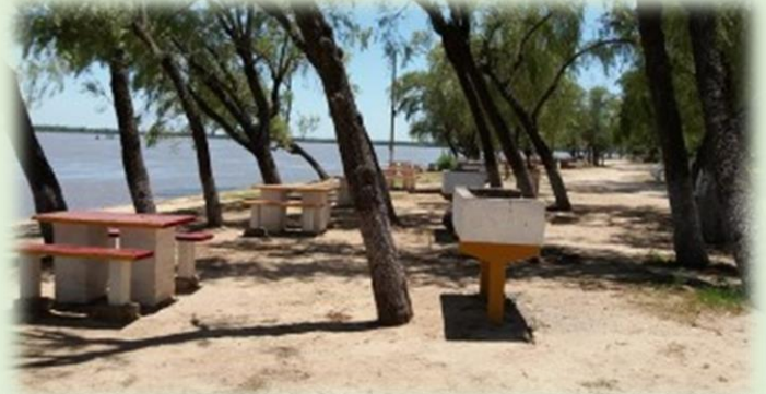
Camping Municipal de Villa Urquiza