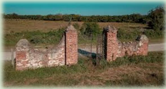
Cementerio Hermanas Franciscanas de Gante