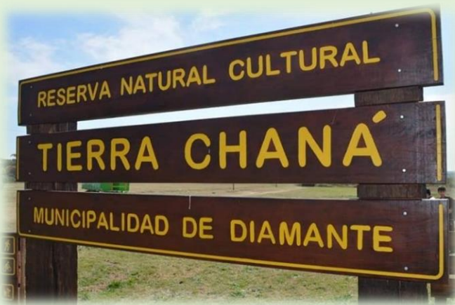
Tierra Chaná Eco Aventura