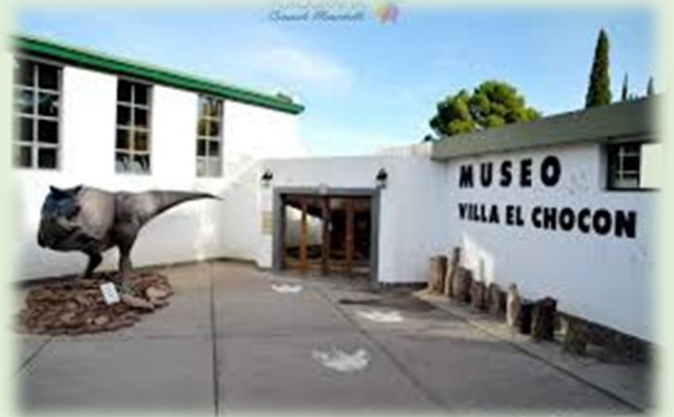
Casa de Sabores Los García