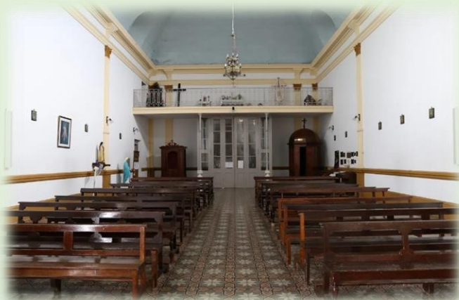
Capilla Nuestra Señora del Rosario Costa Grande