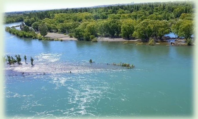
Mirador de la Confluencia