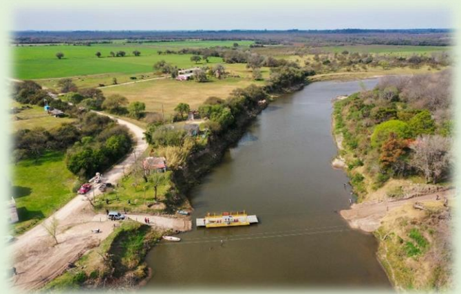
Arroyo Las Conchas