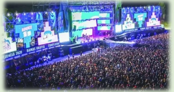
Fiesta Nacional de la Confluencia