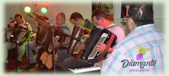
Encuentro de Acordeonistas