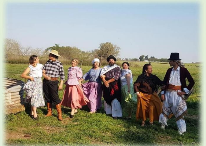
Establecimiento San Antonio