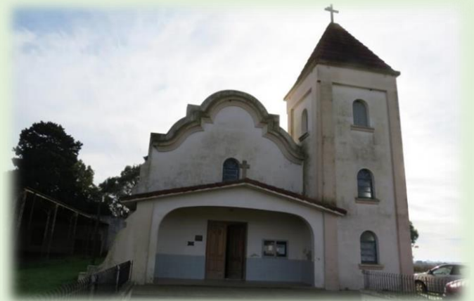
Iglesia Evangélica del Río de la Plata Costa Grande