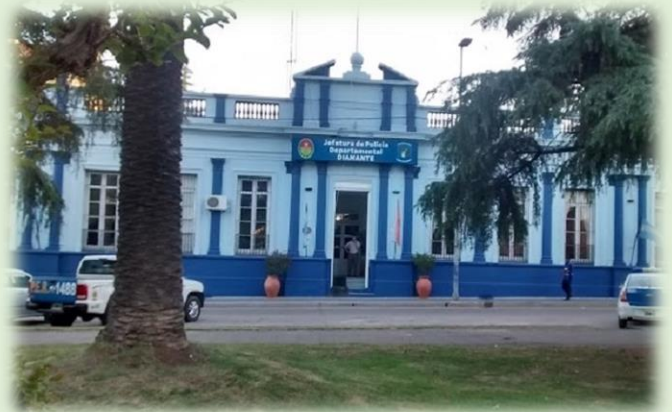
Jefatura de Policía Departamental Diamante