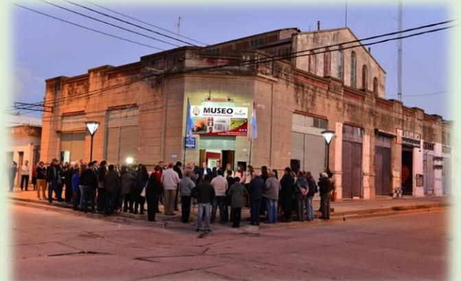
Museo Municipal Regional Diamante