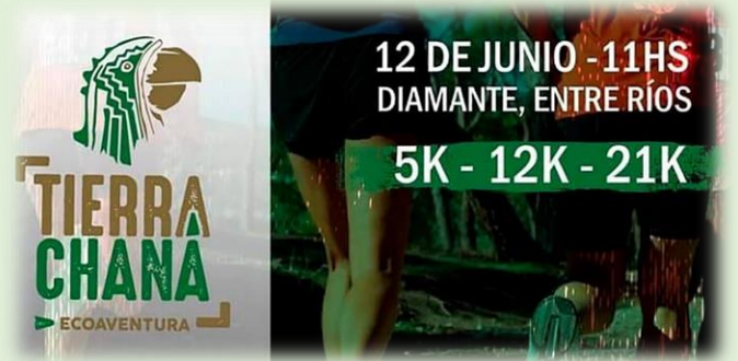
Tierra Chaná Ecoaventura