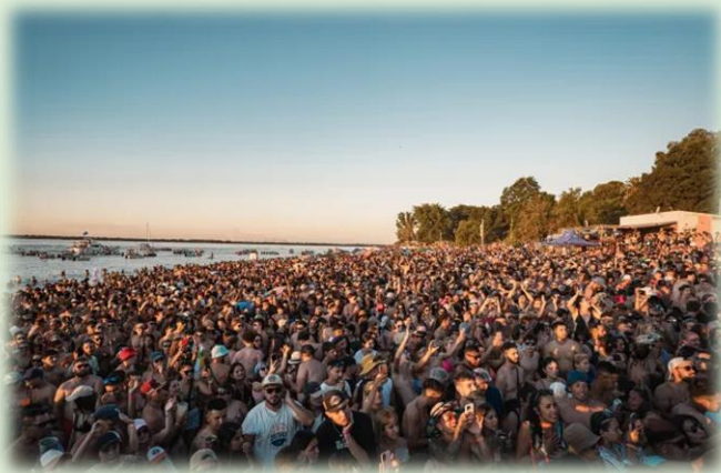
Fiesta de la Playa