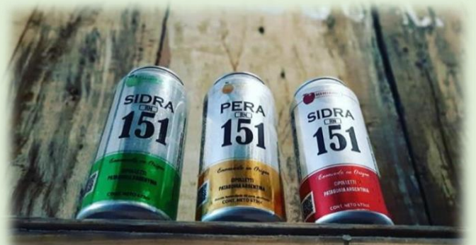
Cooperativa Sidrera La Delicia