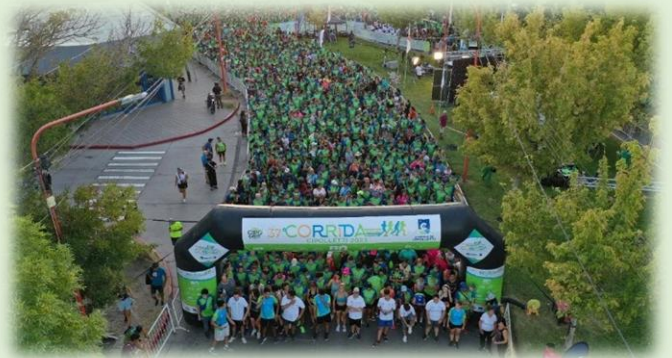
Corrida de Cipolletti