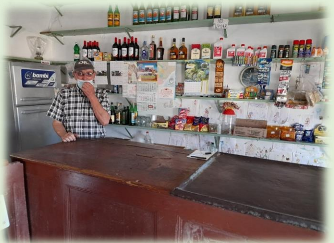
Almacén Rodríguez Costa Grande