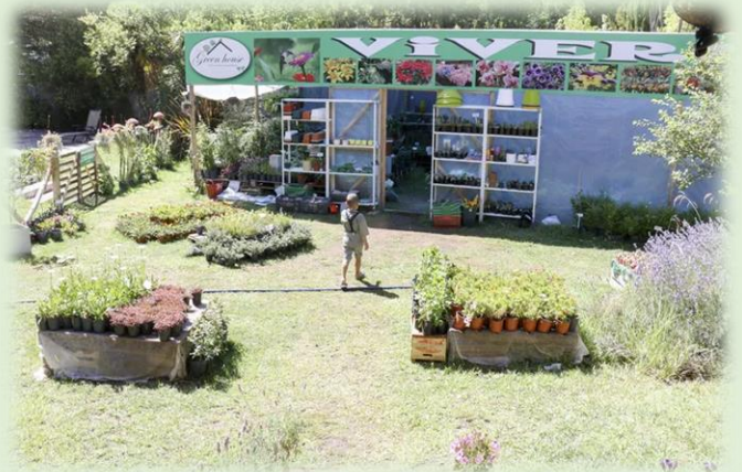
Green House Vivero y Casa de Té