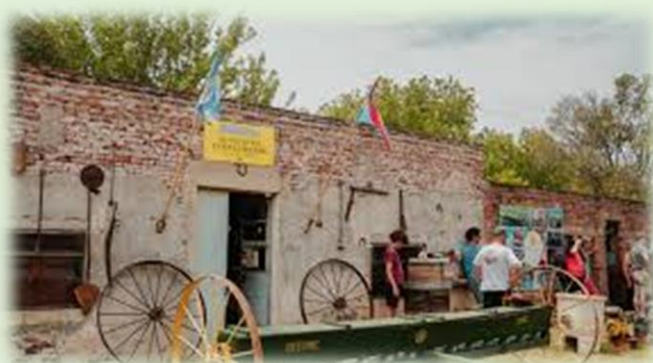
Museo Regional Costa Grande