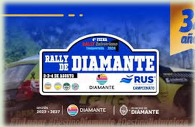
Rally Entrerriano Rio Uruguay Seguros