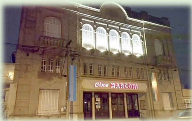
Cine Teatro Marconi