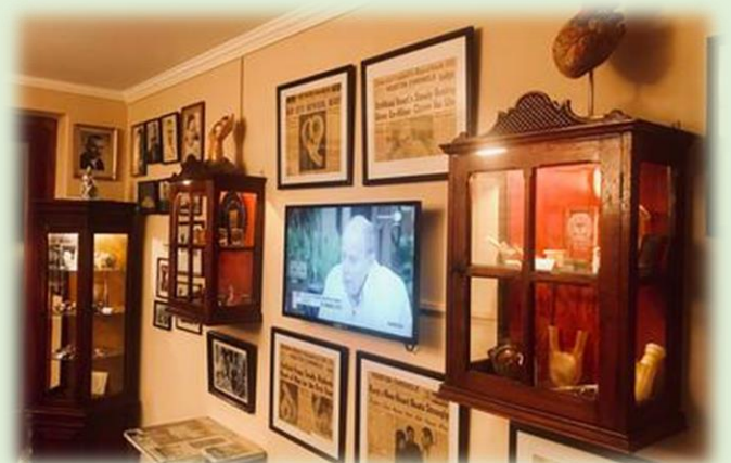
Casa Museo Dr. Domingo Liotta