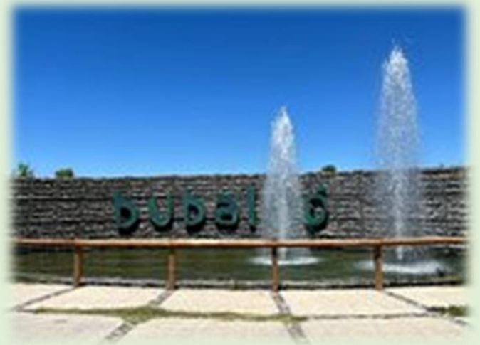
Estación de Piscicultura