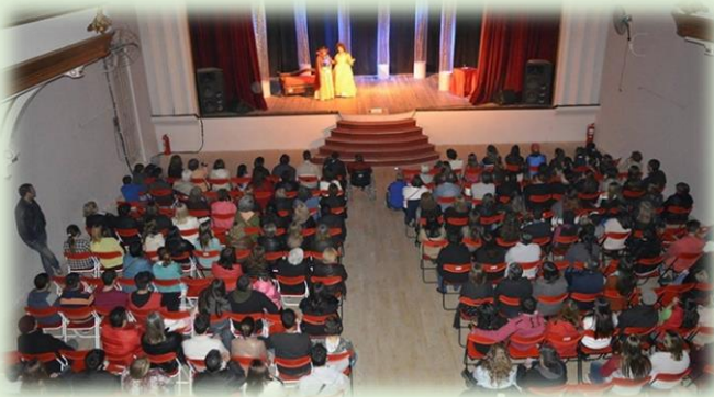
Diamante en Teatro