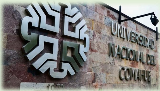
Neucent Granja Educativa