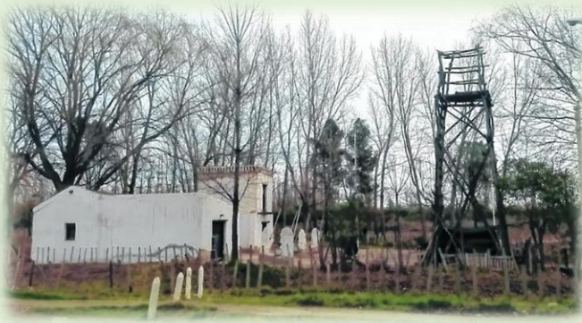
Fortín Primera División