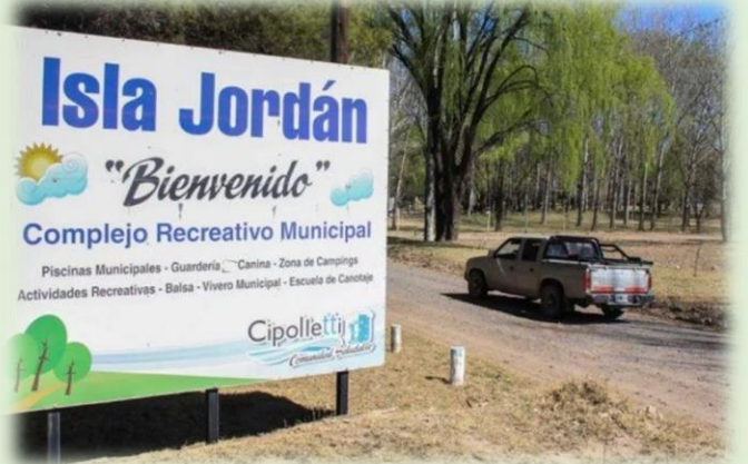
Centro Recreativo Municipal Isla Jordán