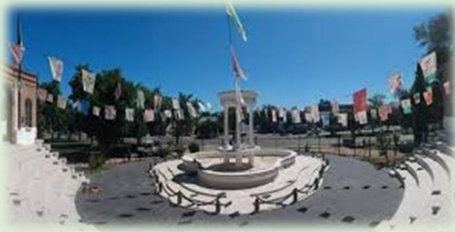
Monumento de los Italianos