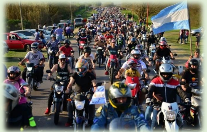
Motoencuentro Internacional Diamante