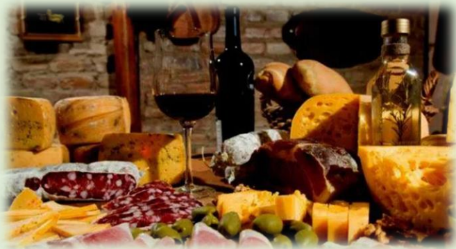
Bodega Museo La Falda