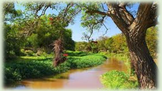
Parque Nacional Pre Delta