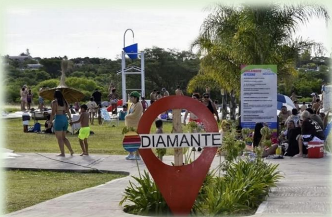
Aniversario de la Fundación de Diamante