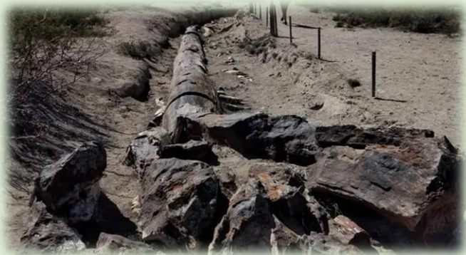
Troncos Fossilizados en Puesto Carús