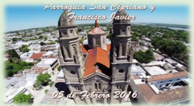
Parroquia San Cipriano y San Francisco Javier