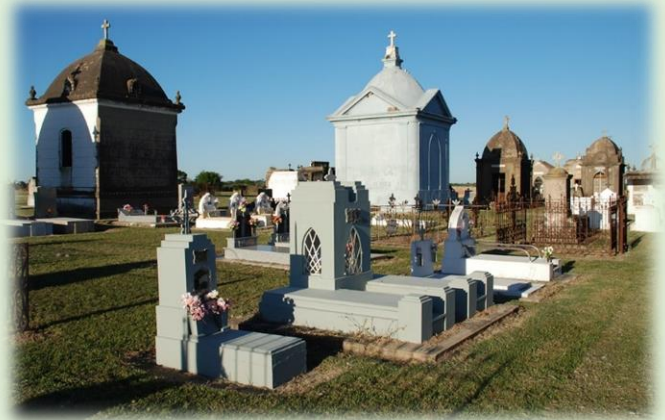
Cementerio Protestante de Villa Urquiza