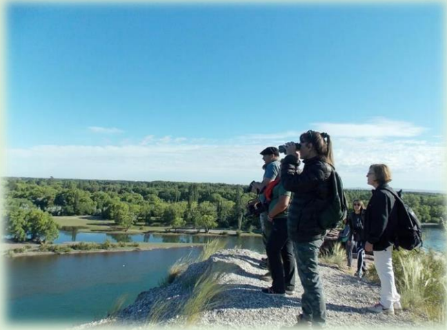
Avistadero de Avifauna