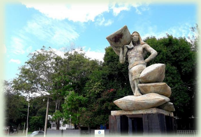
Monumento al Estibador