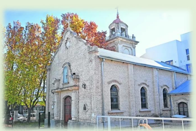
Capilla Histórica Sagrada Familia