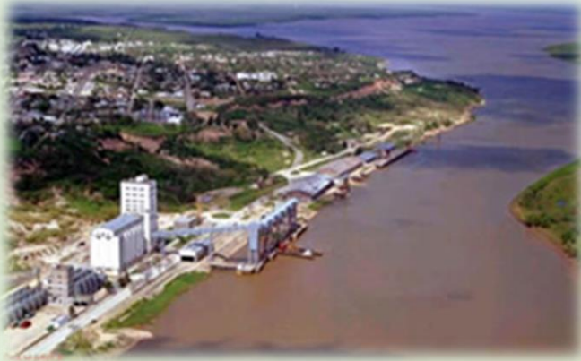
Puerto de Diamante