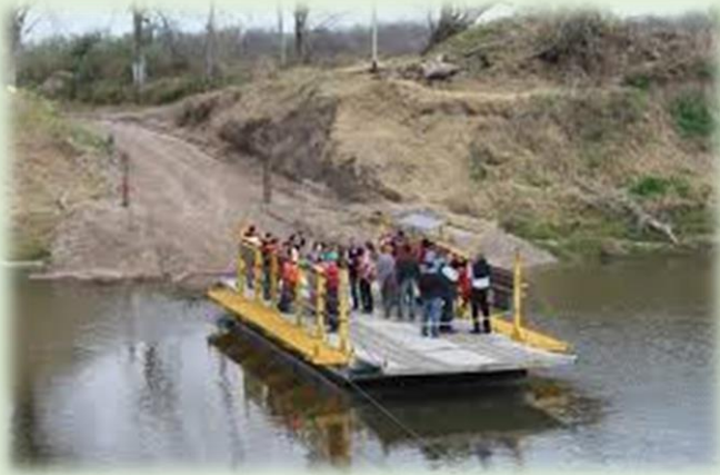
Balsa La Maroma