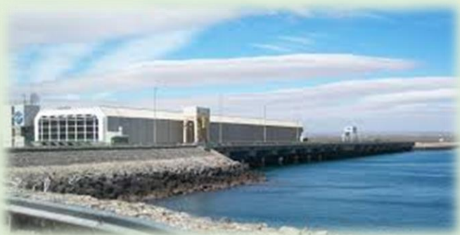
Embalse de Arroyito