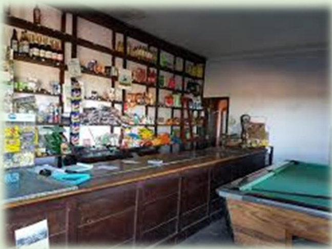
Almacén Capellino Costa Grande