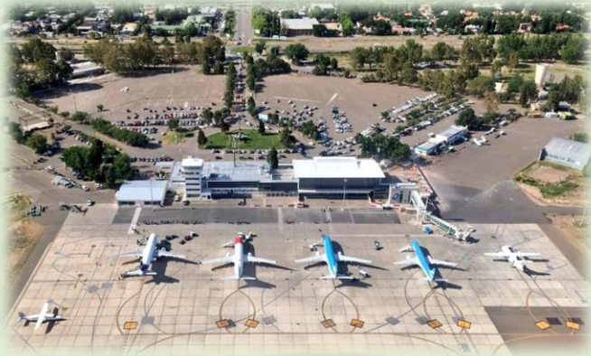
Aeropuerto Internacional Juan Domingo Perón