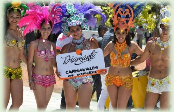
Carnavales de Strobel