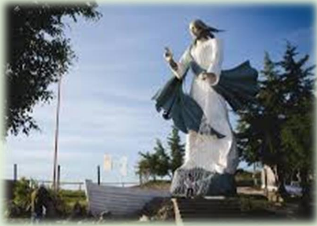
Monumento al Cristo Pescador