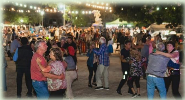
Fiesta Provincial del Estibador