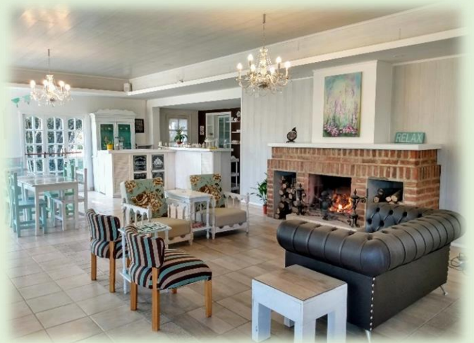
Los Chalets Casita de Té