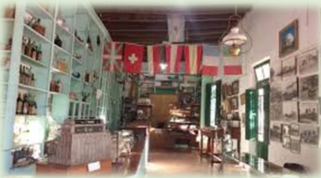
Museo Regional Casa Aceñolaza