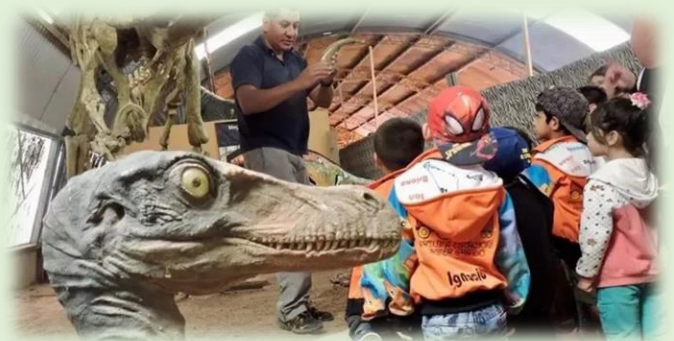
Museo Municipal Ernesto Bachmann