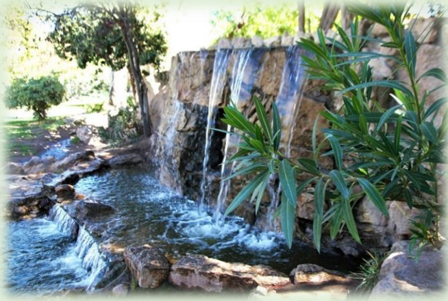
Paseo de la Familia