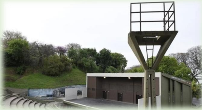
Anfiteatro Municipal de Villa Urquiza