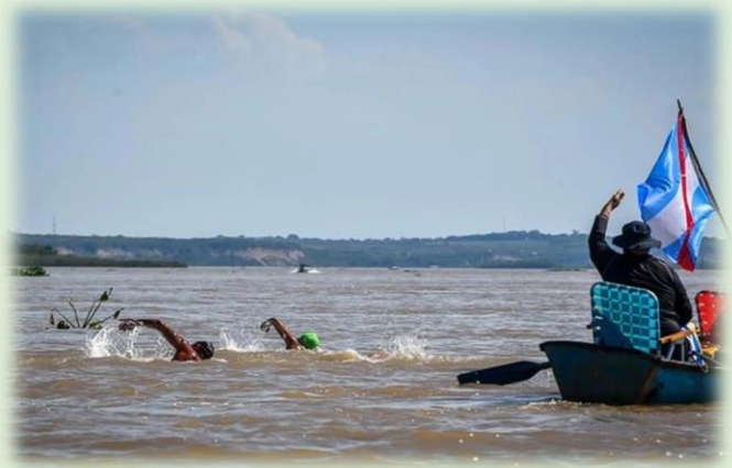
Maratón Acuático Villa Urquiza – Paraná