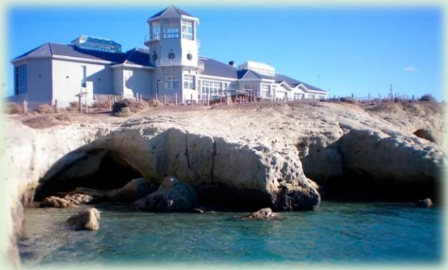
Ecocentro Puerto Madryn