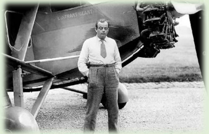
Antoine de Saint Exupéry