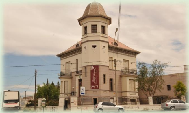
Museo Provincial de Ciencias Naturales y Oceanográfico