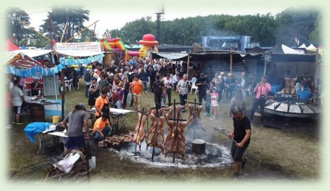
Fiesta Nacional del Cordero