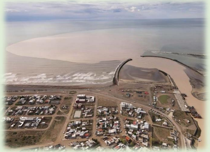
Desembocadura del río Chubut en el Mar Argentino