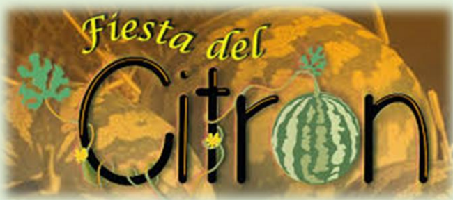
Fiesta del Citrón