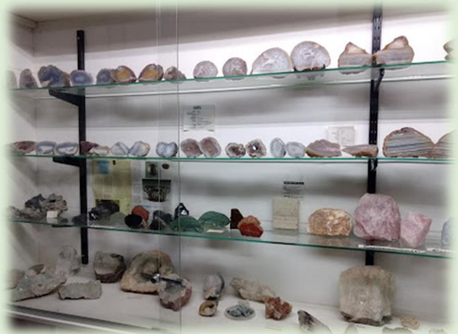
Museo Gemas Madryn