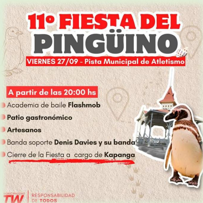
Fiesta Provincial del Pingüino