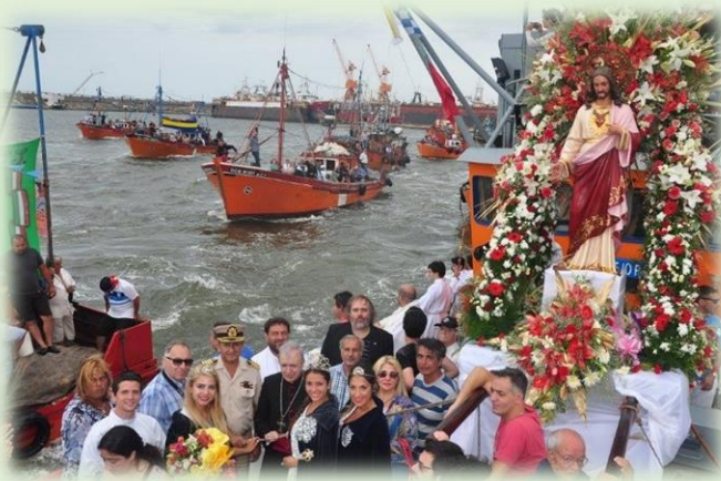
Fiesta Nacional de los Pescadores del Sur