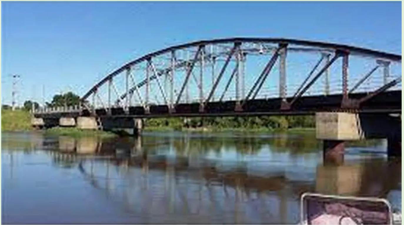
Puente sobre el Arroyo Leyes