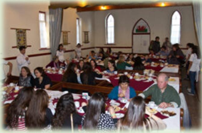
Celebración del Desembarco