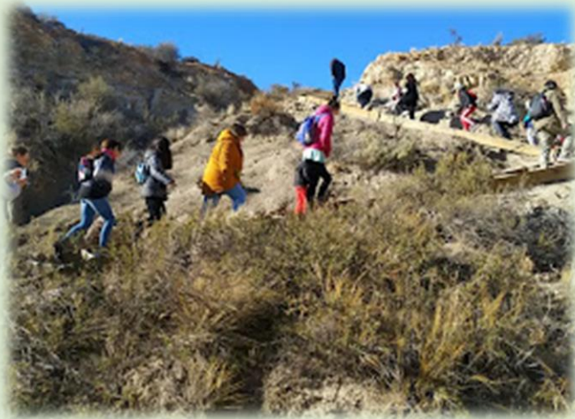
Parque Paleontológico Bryn Gwyn