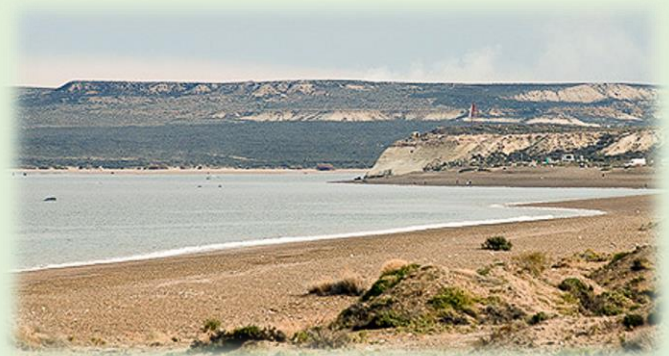
Área Natural Protegida El Doradillo