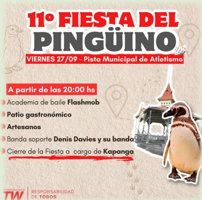
Fiesta Provincial del Pingüino