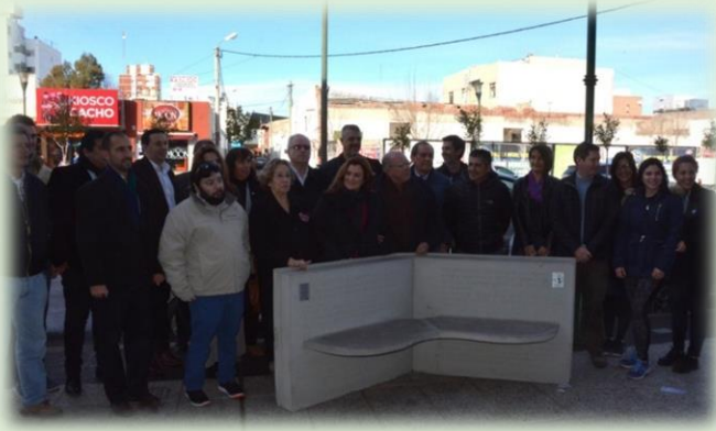
Banco de la Libertad frente al Diario Chubut