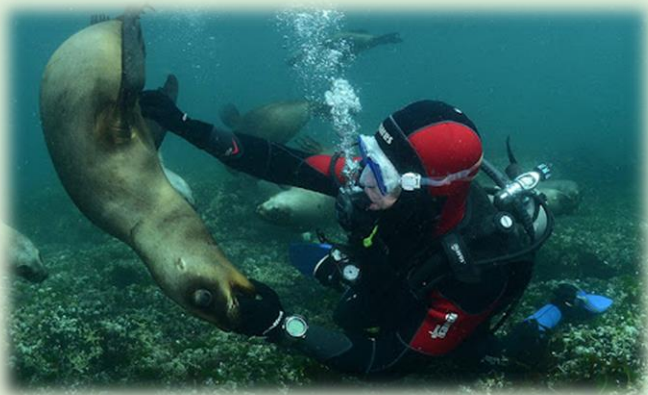
Snorkelling con lobos marinos