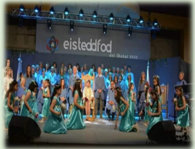
Eisteddfod del Chubut