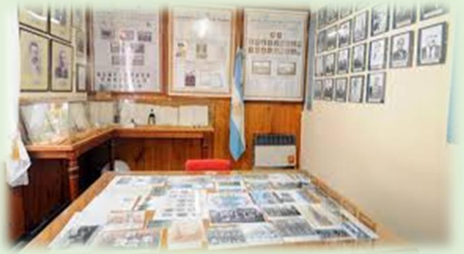
Museo Histórico de la Policía del Chubut