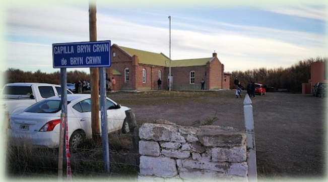
Casa de Té Plas y Coed