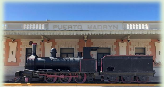
Museo y Archivo Histórico de Puerto Madryn