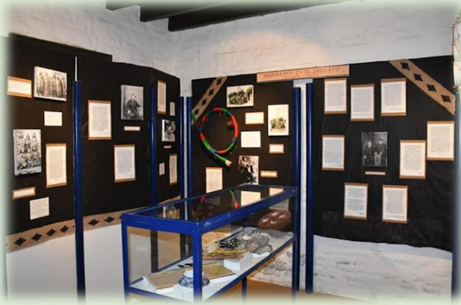
Museo Tehuelche Mapuche de Gaiman