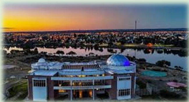
Centro Astronómico Trelew