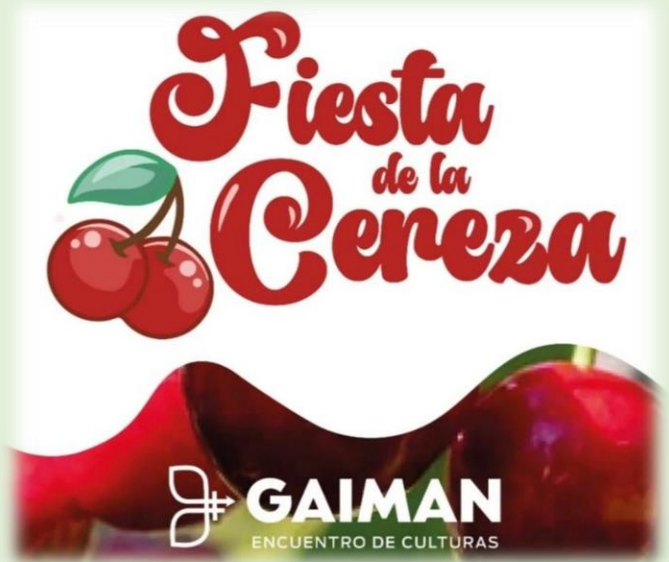
Fiesta de la Cereza