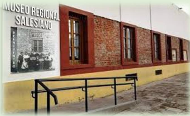
Museo Regional Salesiano