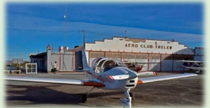
Aero Club Trelew