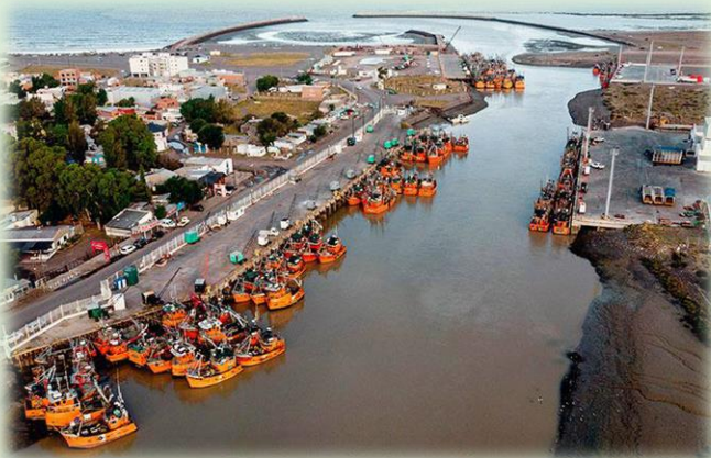
Puerto de Rawson