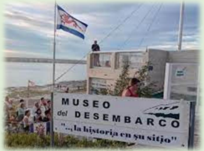
Museo del Desembarco Punta Cuevas