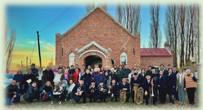
Capilla de Seion