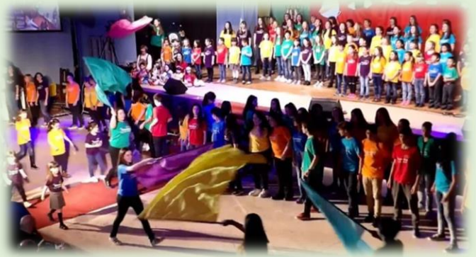
Eisteddfod de la Juventud