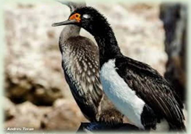
Cormorán de cuello negro