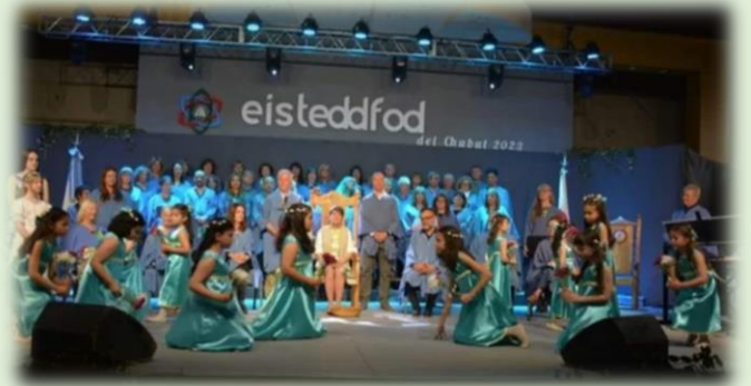
Eisteddfod del Chubut