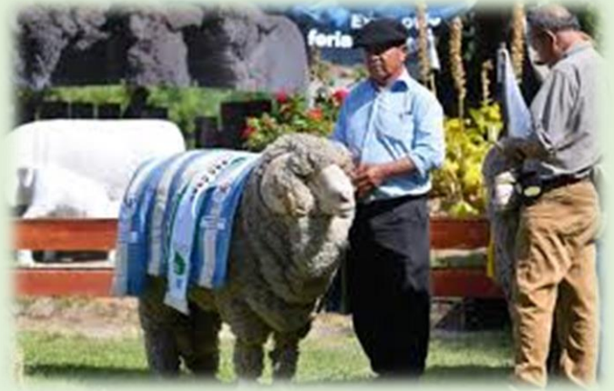
Expo Rural Trelew