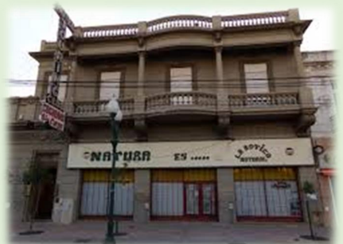
Hotel Touring Club