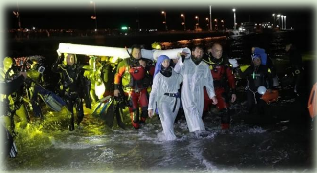
Vía Crucis Submarino