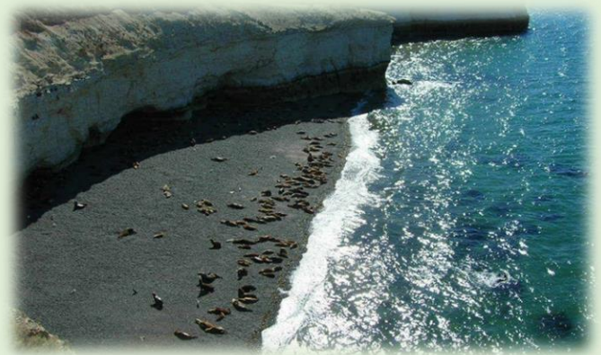
Área Natural Protegida Punta Loma