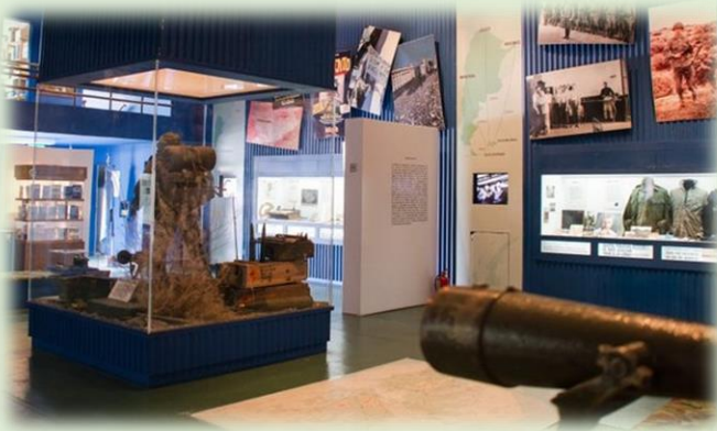
Museo del Soldado de Malvinas