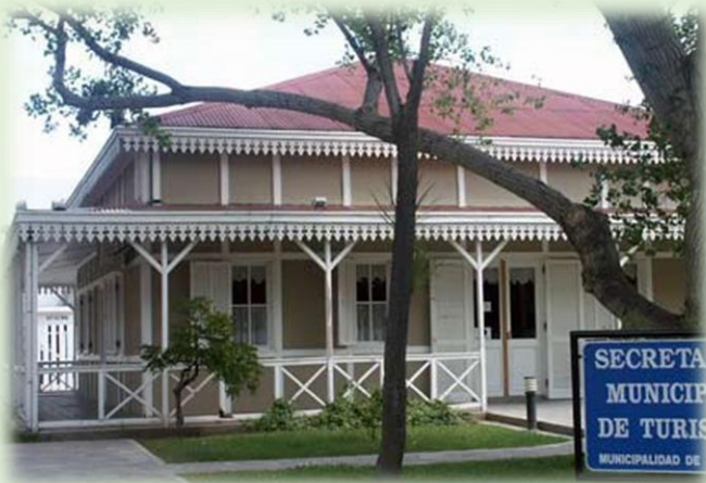
Dirección de Turismo de Trelew