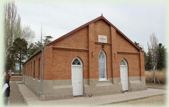
Casa de Té Nain Glenys