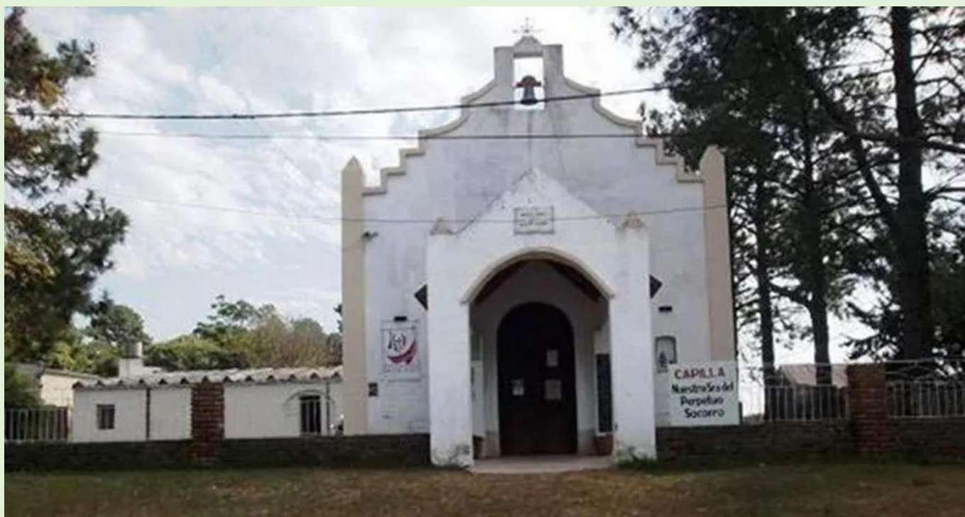
Capilla Nuestra Señora del Perpetuo Socorro

Los Junqueros | 400m al Oeste (0342) 510 2063 https://g.co/kgs/LSg6uar