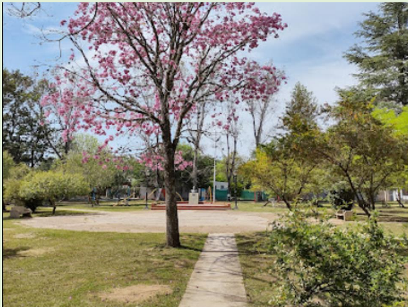
Plaza San Martín