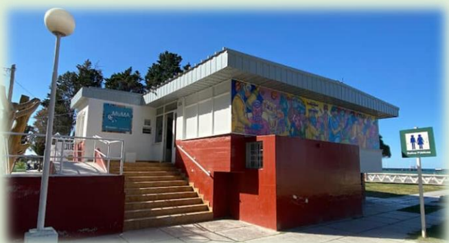
Museo Municipal de Arte de Puerto Madryn