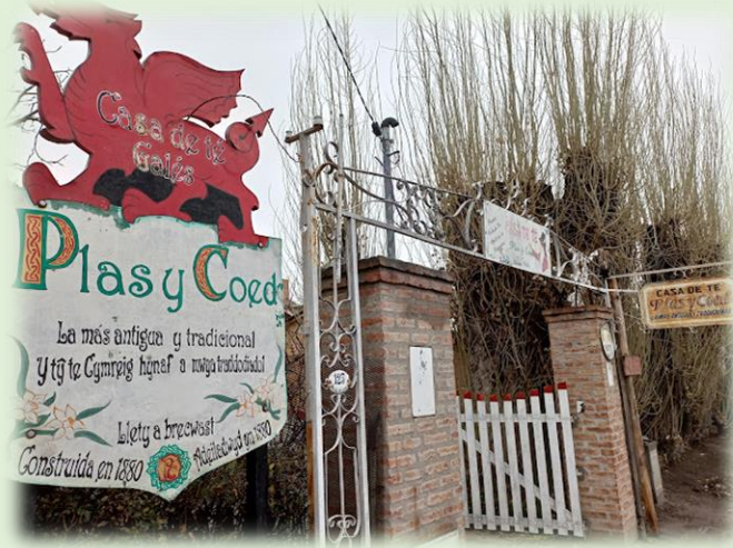
Casa de Té Gaiman