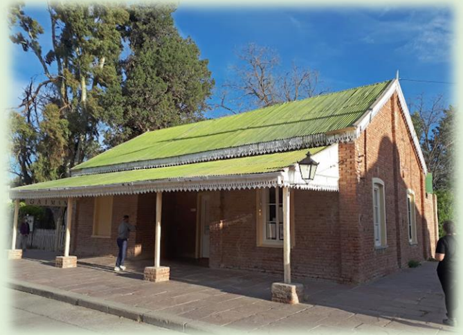
Museo Histórico Regional de Gaiman