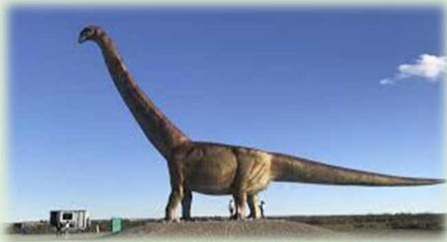
Patagotitan mayorus (réplica a tamaño natural)