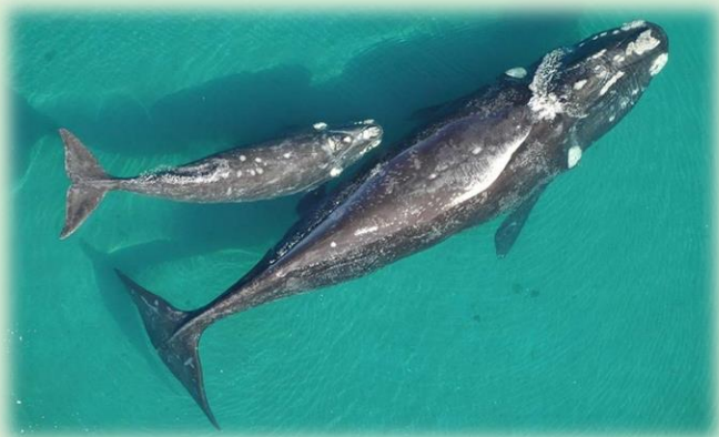
Ballena Franca Austral