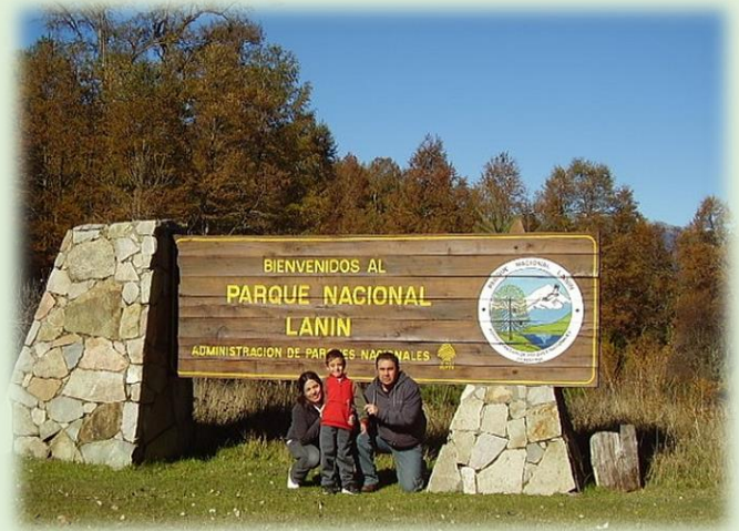
Parque Nacional Lanín