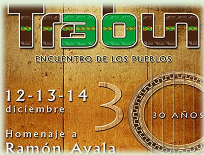
Trabún, Encuentro de los Pueblos