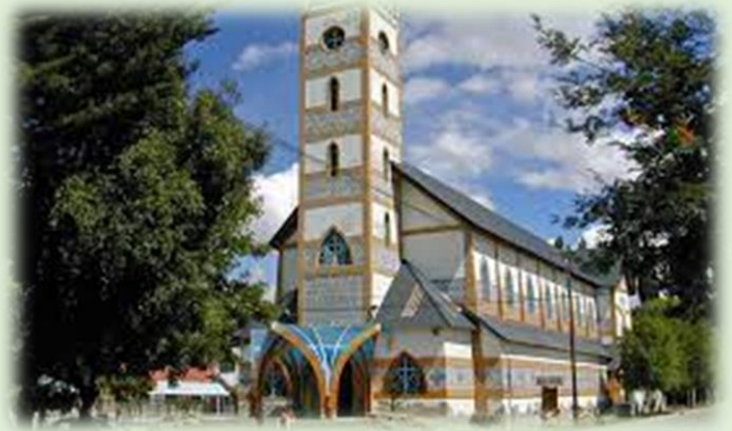
Santuario Nuestra Señora de las Nieves y de la Beata Laura Vicuña