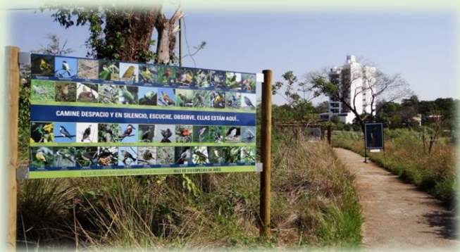
Reserva Urbana Arroyo Itá