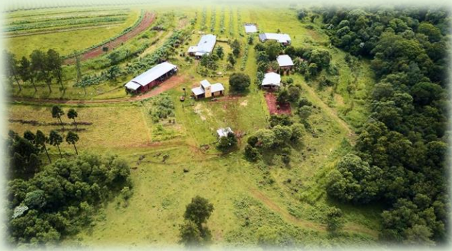
Granja Agroecológica La Lechuza