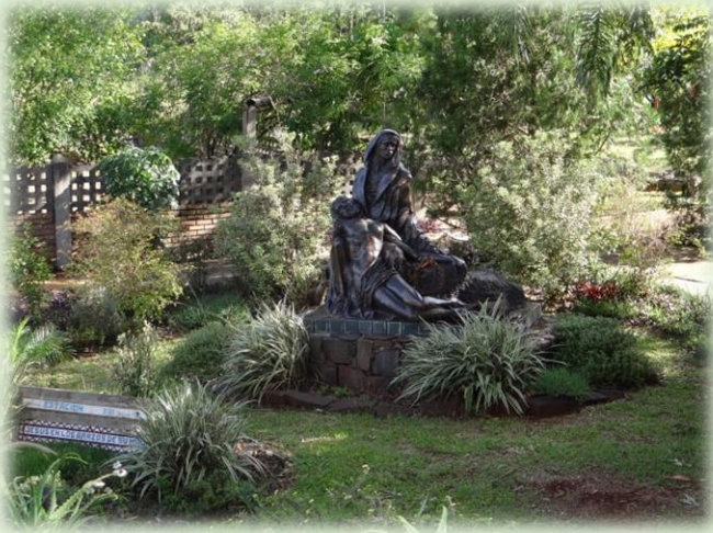
Jardín Botánico Yvirá Reta