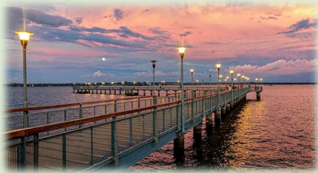
Muelle de los Pescadores