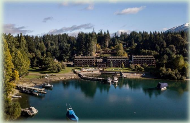
Bahía de Puerto Manzano