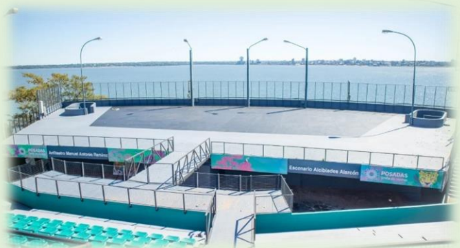
Anfiteatro Manuel Antonio Ramírez