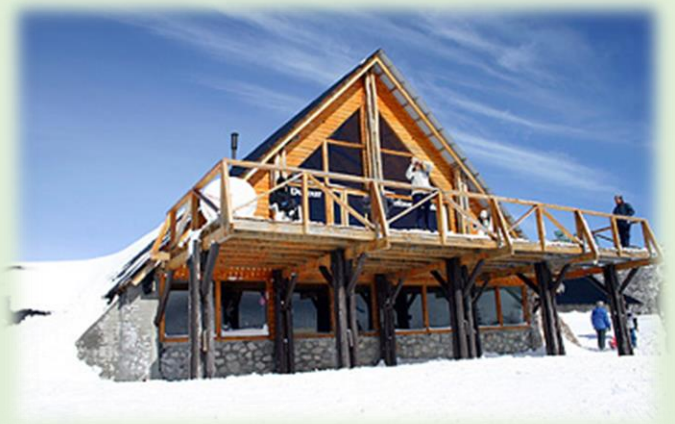
Parque de Nieve Batea Mahuida