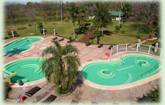
Parque de la Selva