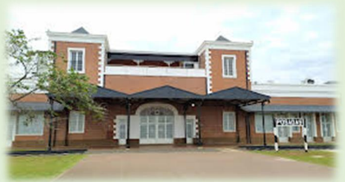
Villa Cultural La Estación