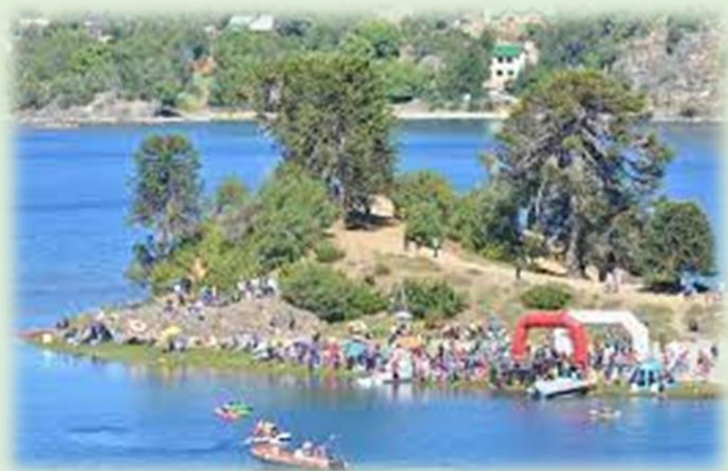
Fiesta Provincial del Lago y las Araucarias