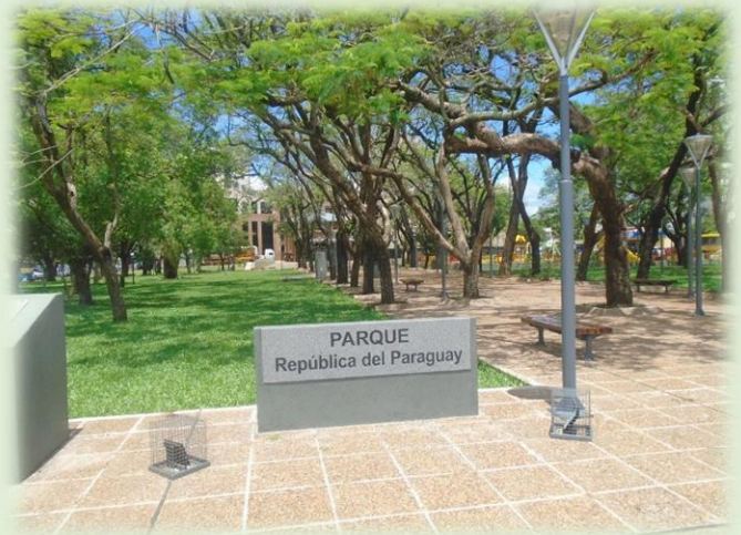
Parque República del Paraguay