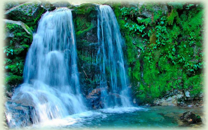
Senda Río Bonito