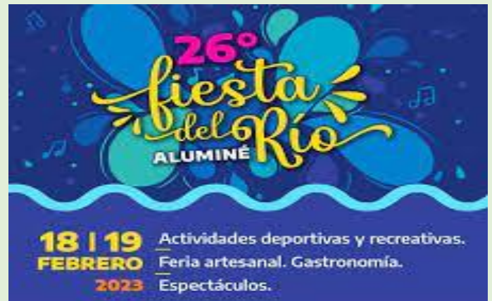
Fiesta del Río