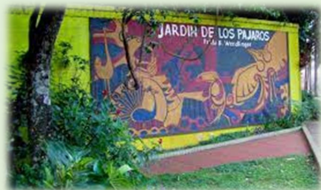
Jardín de los Pájaros