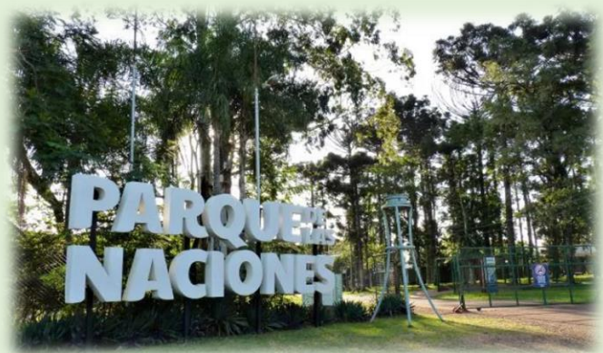
Parque de las Naciones