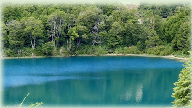
Senda Brazo Última Esperanza