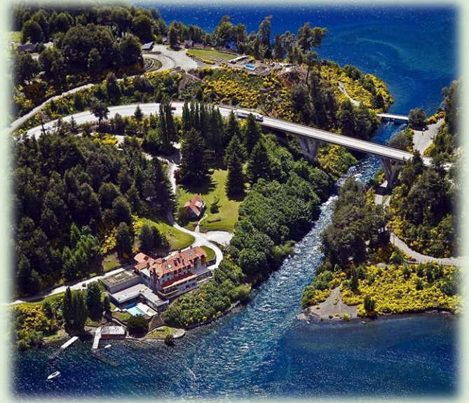
Puente y Balneario sobre el río Correntoso