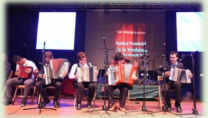
Festival Provincial de la Verdulera "Maestro Ricardo Vuori"