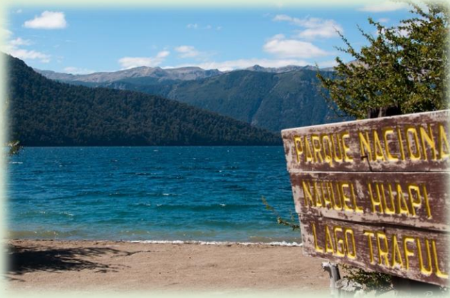
Parque Nacional Nahuel Huapi