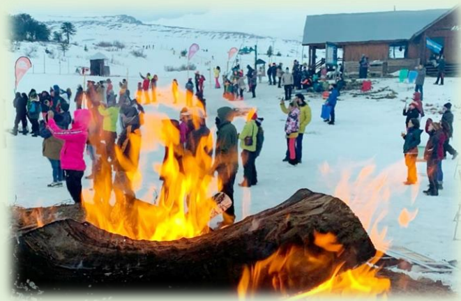
Fiesta de la Nieve