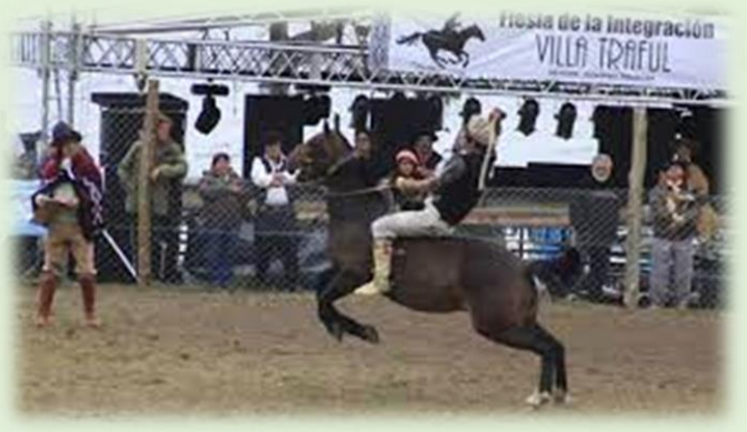
Fiesta Provincial de la Integración