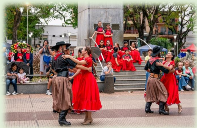
Fiesta del Folclore Misionero