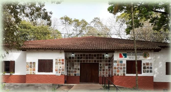
Museo y Archivo Histórico