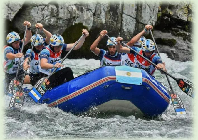
Mundial de Rafting