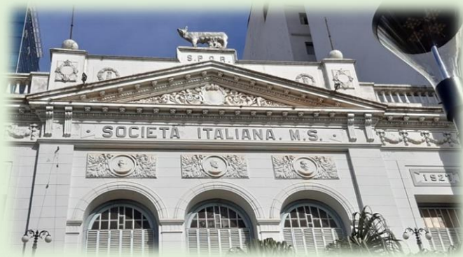
Sociedad Italiana de Socorros Mutuos