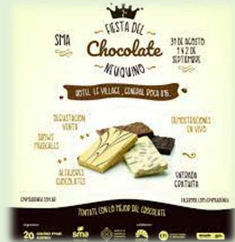
Fiesta del Chocolate Neuquino