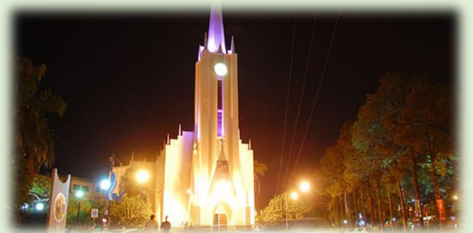
Catedral San Antonio de Padua