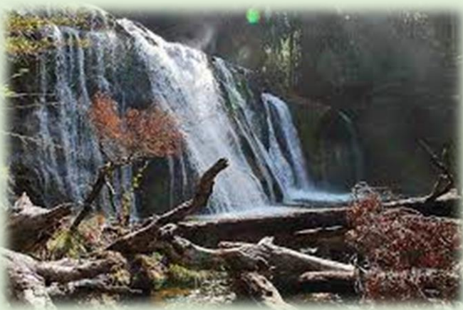
Cascadas Ñivinco y Pichi Traful