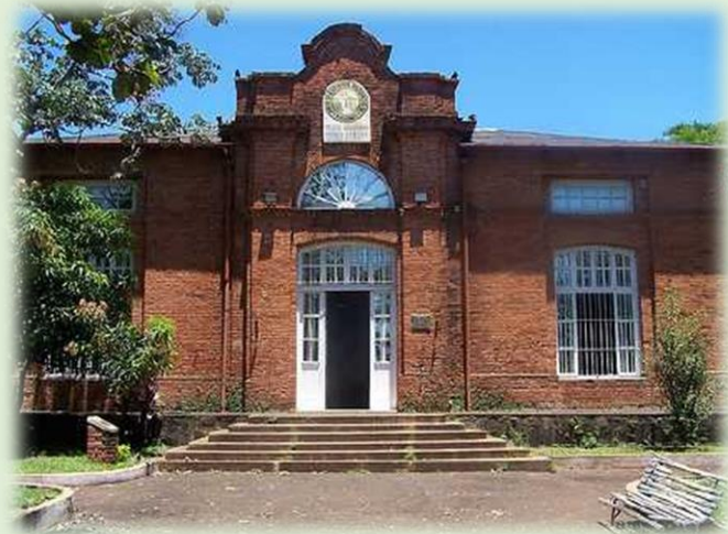
Museo Regional Aníbal Cambas