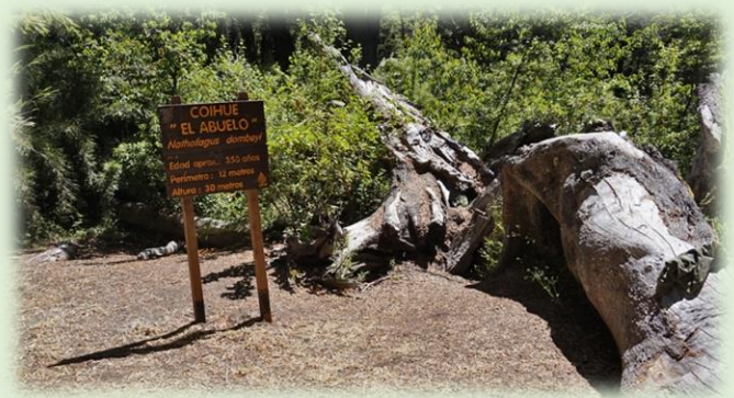
Coihue El Abuelo