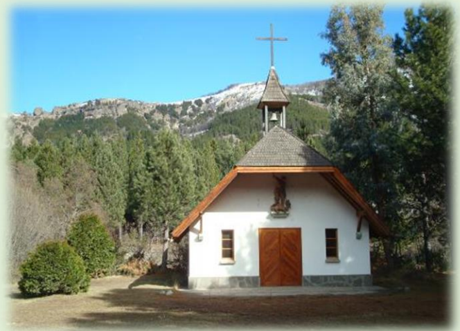
Capilla San Jorge