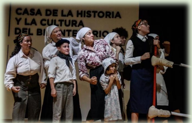
Murga del Monte