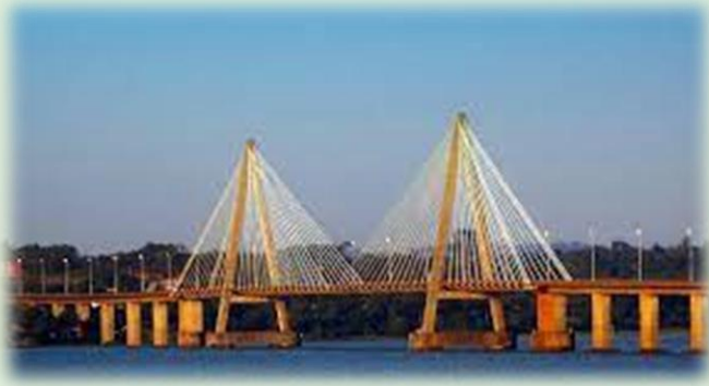
Puente Internacional San Roque González de Santa Cruz