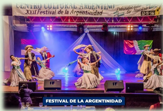
Festival de la Argentinidad