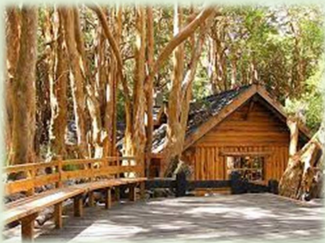
Parque Nacional Los Arrayanes