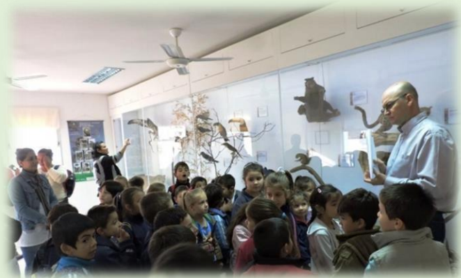
Museo de Ciencias Naturales e Historia