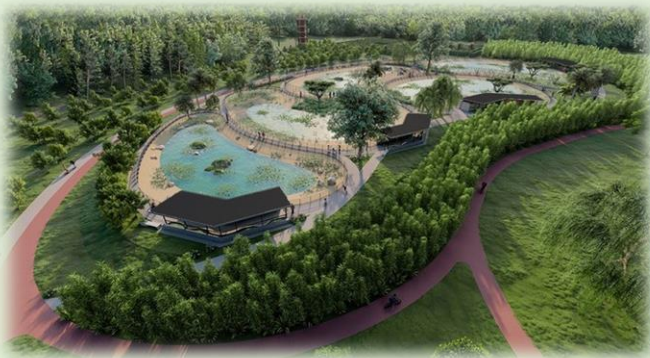
Jardín Botánico Alberto Roth