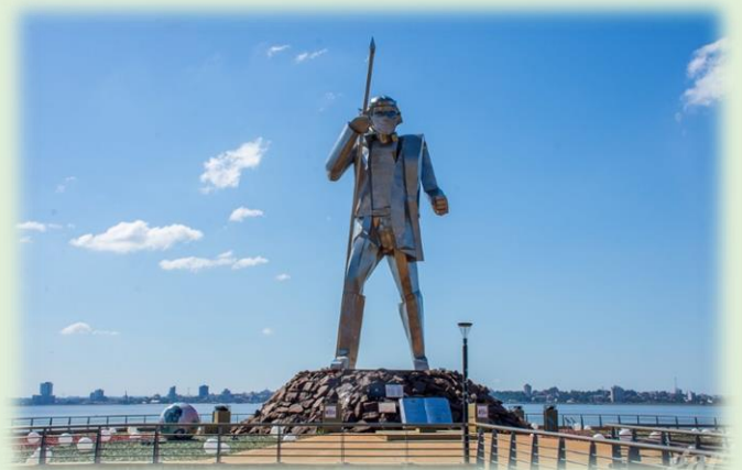
Monumento a Andresito Guacurarí