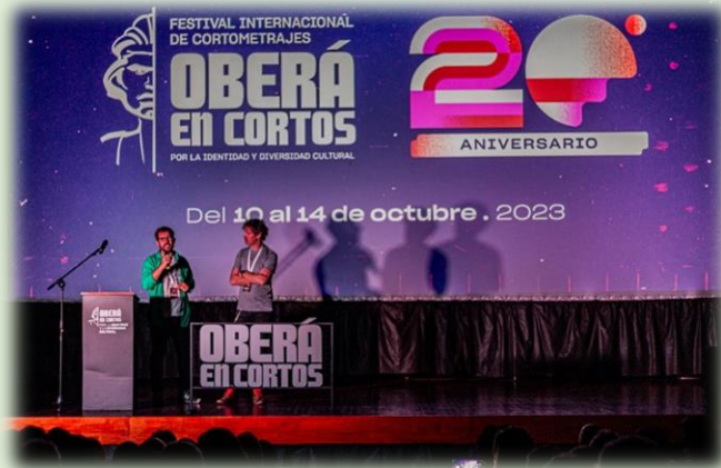
Oberá en Cortos Festival Internacional de Cortometrajes