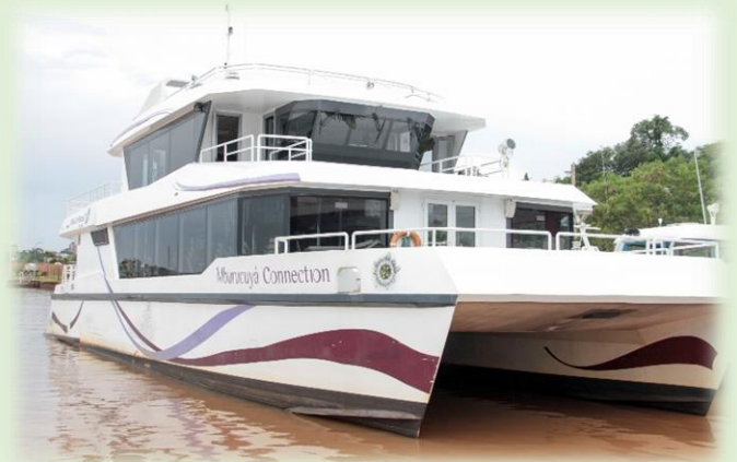
Catamarán Mburucuyá Connection