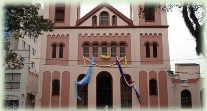
Catedral de San José