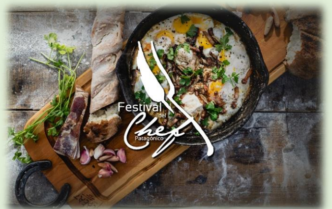
Festival del Chef Patagónico