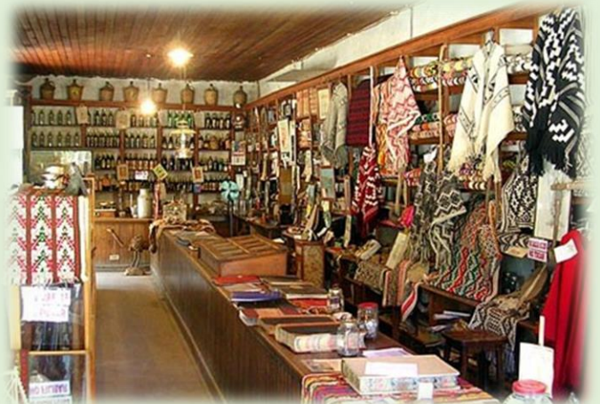
Centro Cultural y Artesanal Mapuche