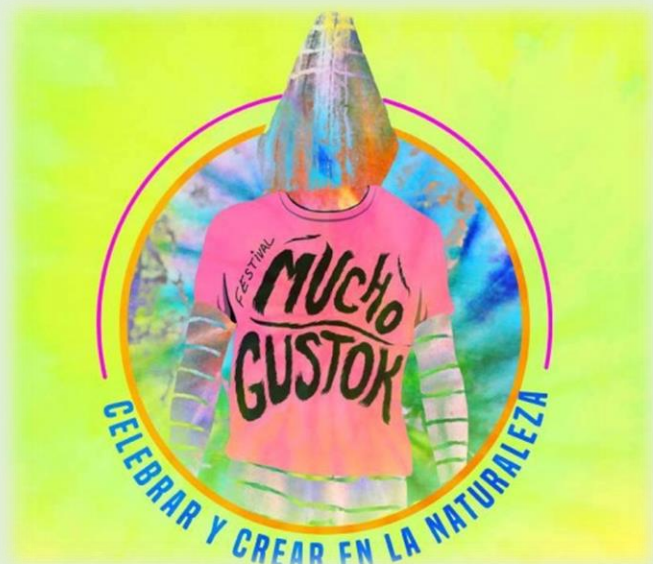
Festival Mucho Gustok