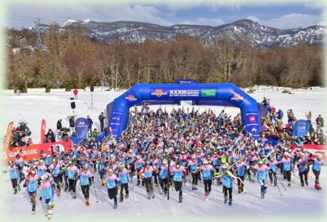
Tetratlón de Chapelco