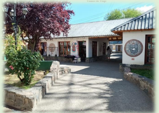
Paseo Artesanal Parque Centenario