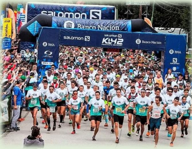
K42 Villa La Angostura