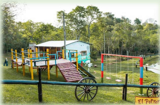
Granja Educativa El Potrero