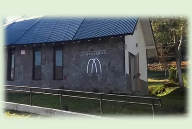
Museo de Arte Contemporáneo Conrad Meier