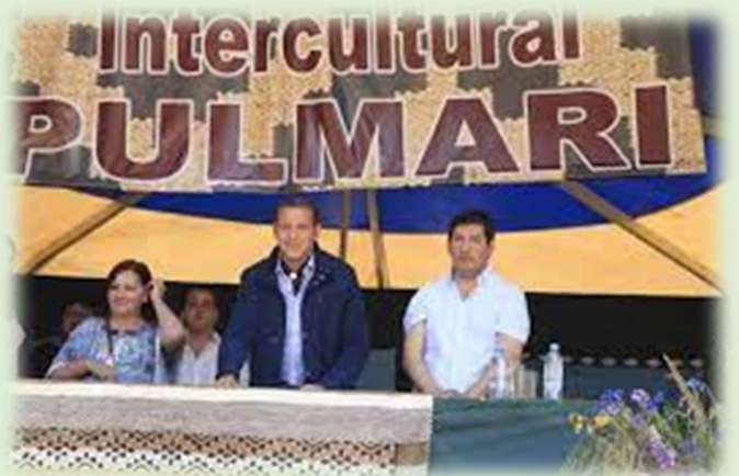
Fiesta Provincial Intercultural Pulmarí