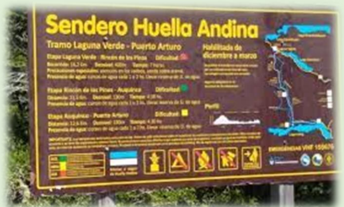
Sendero Huella Andina