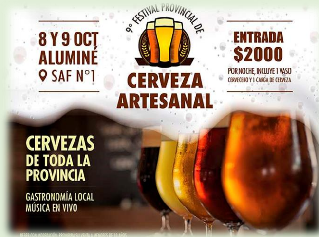
Fiesta Provincial de la Cerveza Artesanal