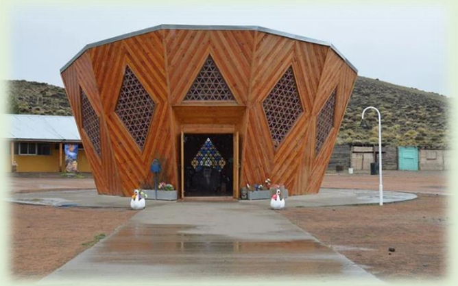
Santuario de Ceferino Namuncurá