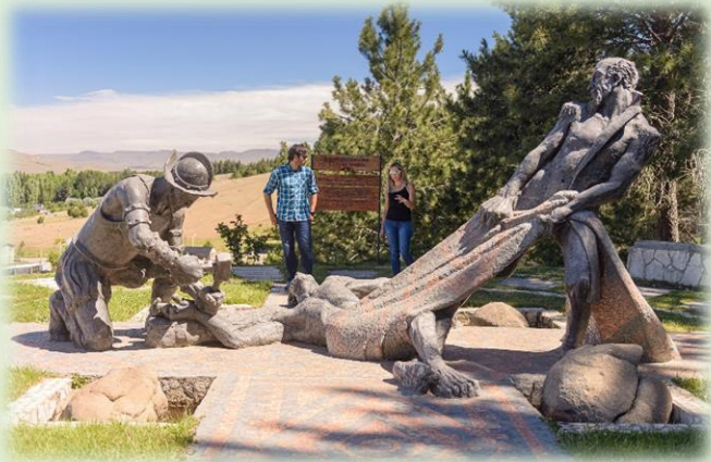
Parque Vía Christi