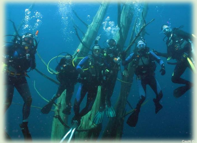
Buceo en el lago Traful