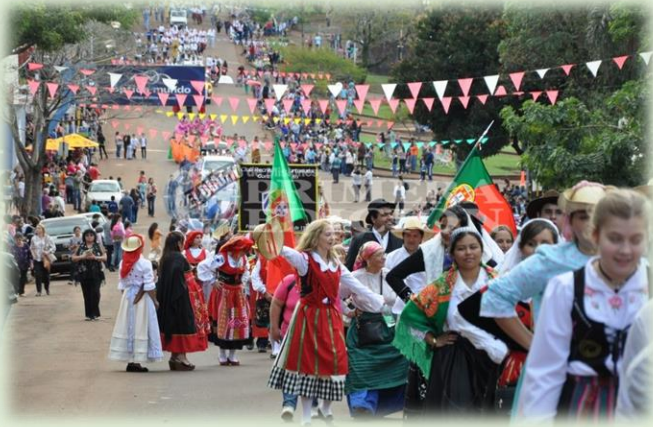
Fiesta Nacional del Inmigrante