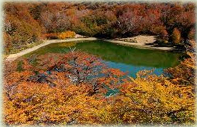
Reserva Natural Laguna Verde