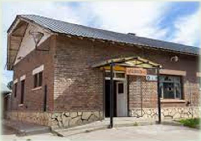
Museo Arqueológico Municipal