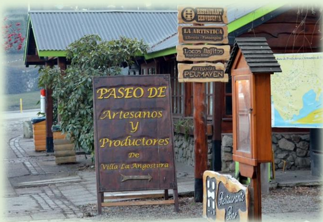
Paseos de Artesanos y Productores