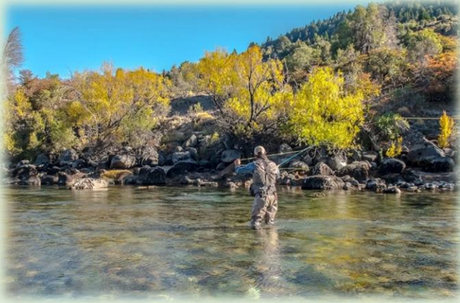
Pesca con mosca