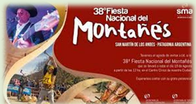
Fiesta Nacional del Montañés