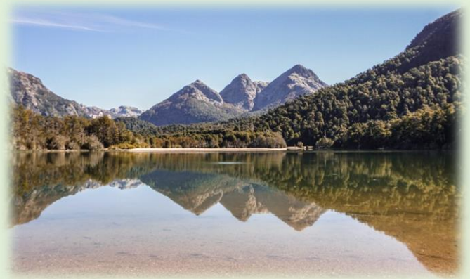
Laguna Piré y Playa Brazo Rincón