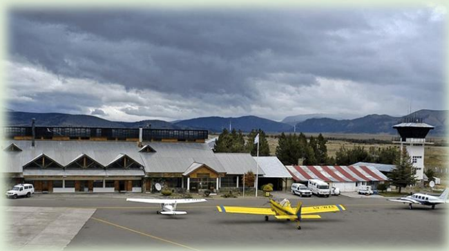
Aeropuerto Aviador Carlos Campos