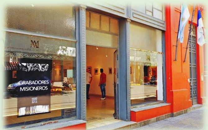
Museo Provincial de Bellas Artes Juan Yaparí