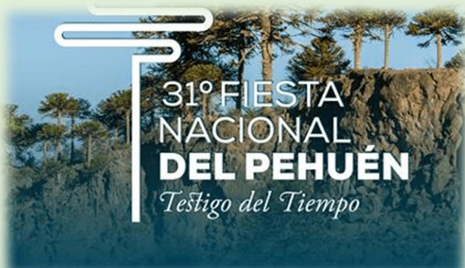
Fiesta Nacional del Pehuén