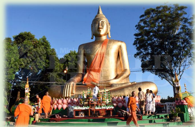
Templo Budista Wat Lao Rattanaangsiyaram