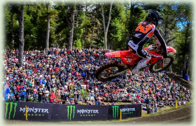
MX Grand Prix of Patagonia-Argentina