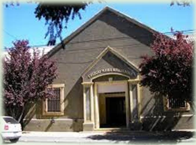
Colegio María Auxiliadora