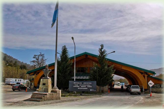
Paso Internacional Cardenal Samoré