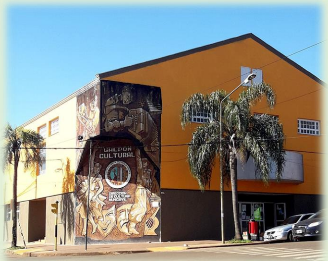
Casa de la Historia y la Cultura del Bicentenario