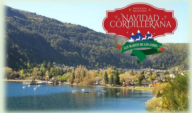
Fiesta Nacional de la Navidad Cordillerana