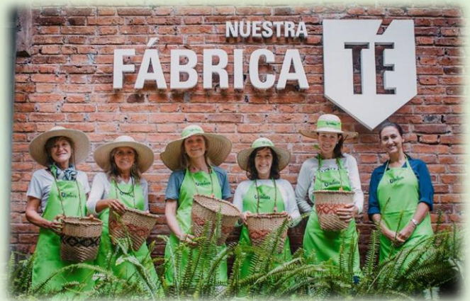
La Ruta del Té