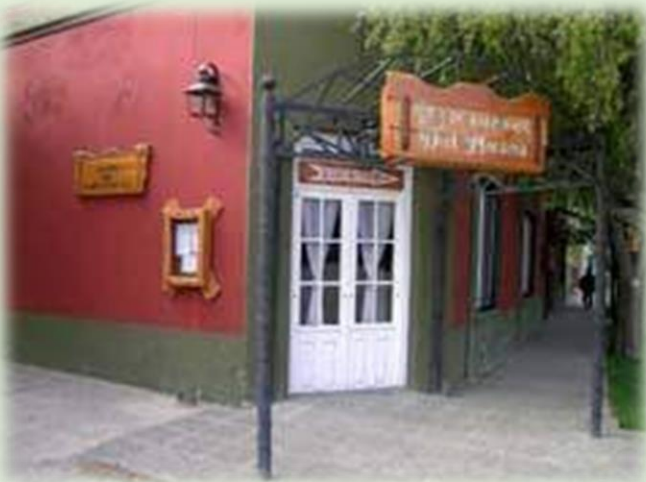
Museo Moisés Roca Jalil