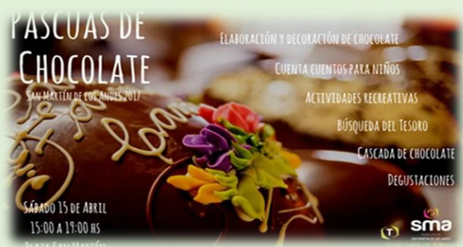
Pascua de Chocolate