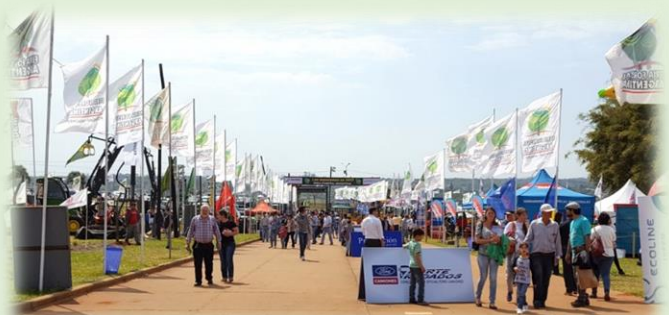
Feria Forestal Argentina