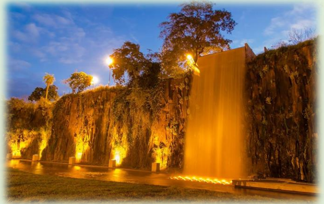
Parque La Cantera