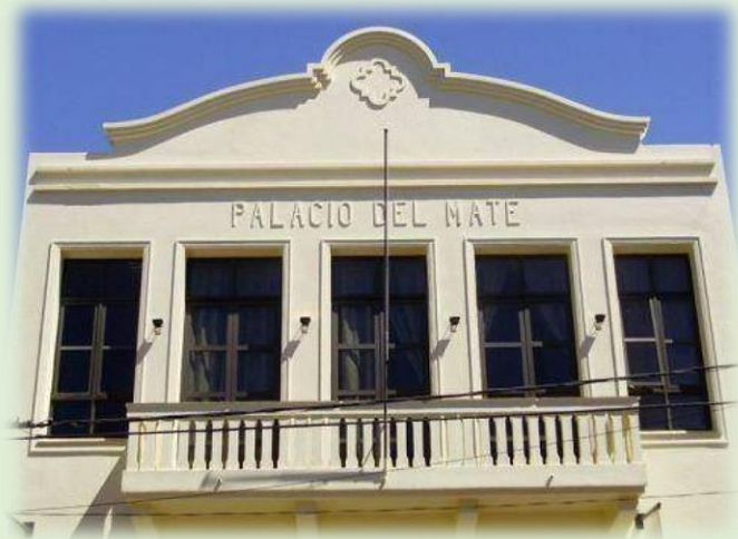
Museo Municipal de Bellas Artes Lucas Braulio Areco