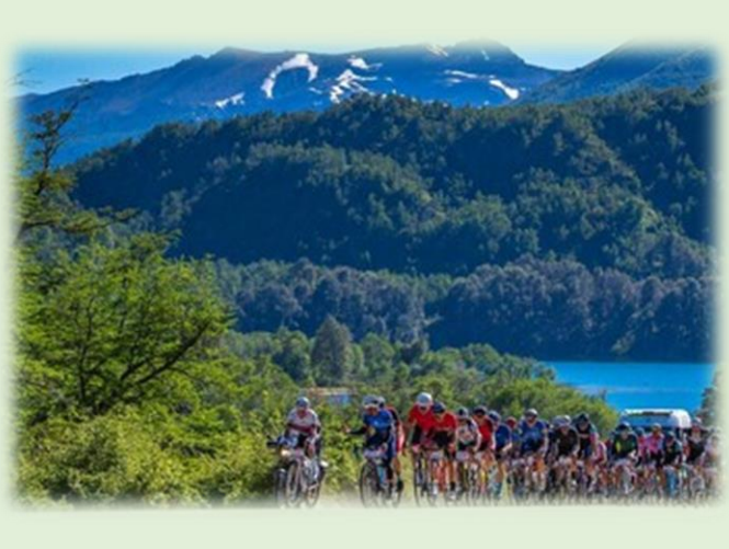
Gran Fondo 7 Lagos