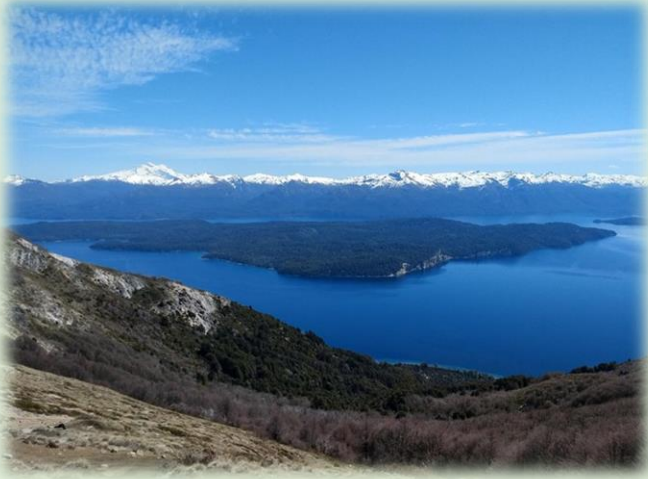
Senda Cerro Centinela