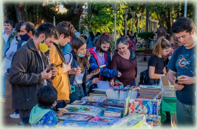
Feria del Libro Usado y de Libros Libres