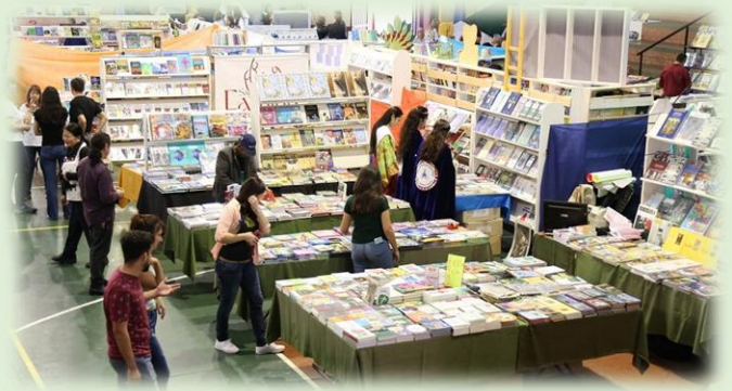
Feria Provincial del Libro