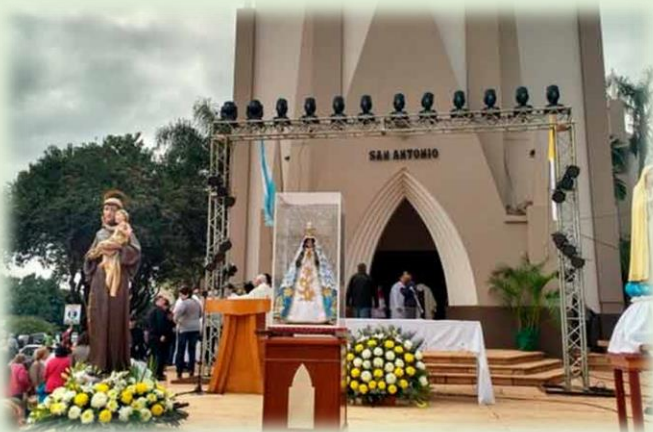
Festividad de San Antonio de Padua