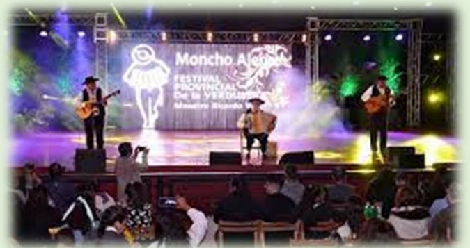
Festival Provincial del Chamamé