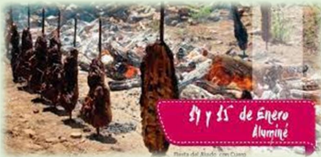
Fiesta Provincial del Asado con Cuero