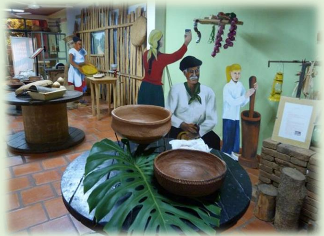
Museo Histórico y Arqueológico Andrés Guacurarí