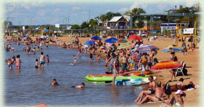
Playas El Brete y Costa Sur