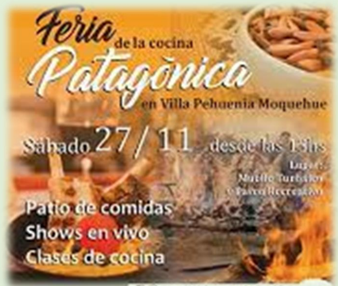
Feria de la Cocina Patagónica