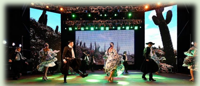
Festival Nacional de la Música del Litoral