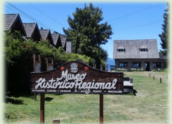
Museo Histórico Regional