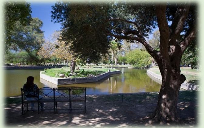
Parque Adán Quiroga