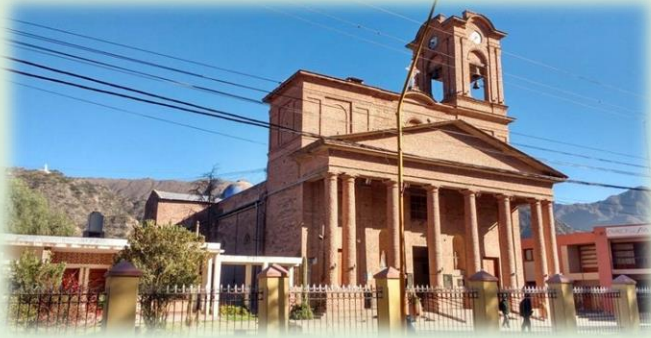
Santuario de Nuestra Señora de Belén