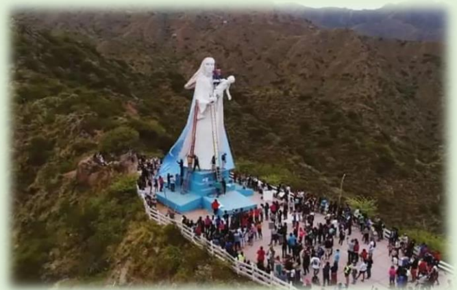
Imagen de Nuestra Señora de Belén