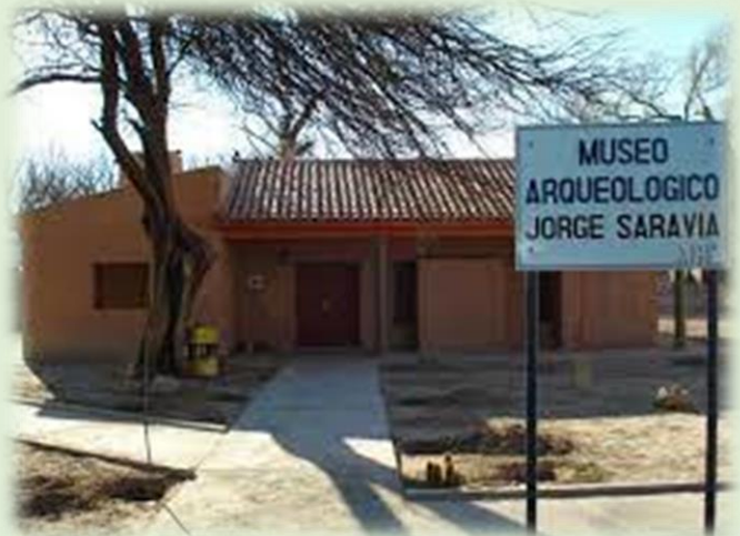
Museo Arqueológico Jorge Saravia Leguizamón