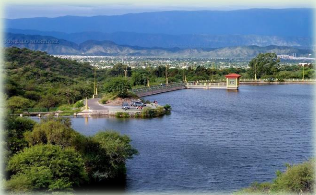
Dique El Jumeal