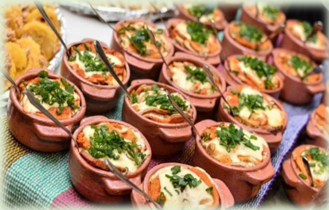
Fiesta Nacional del Jigote