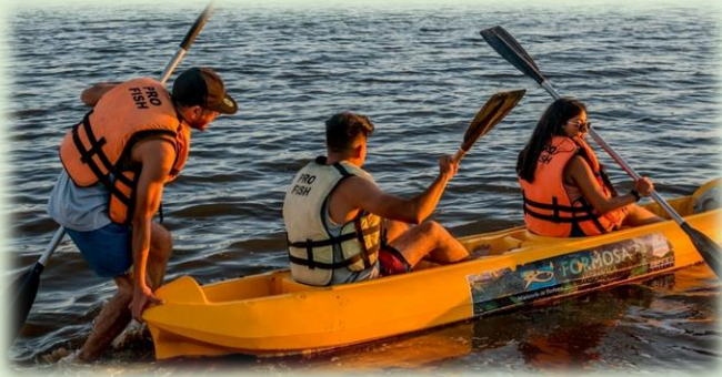
Ciudad de Formosa Reserva de Biósfera Laguna Oca