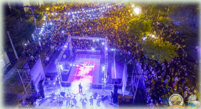
Fiesta Provincial de la Zanahoria