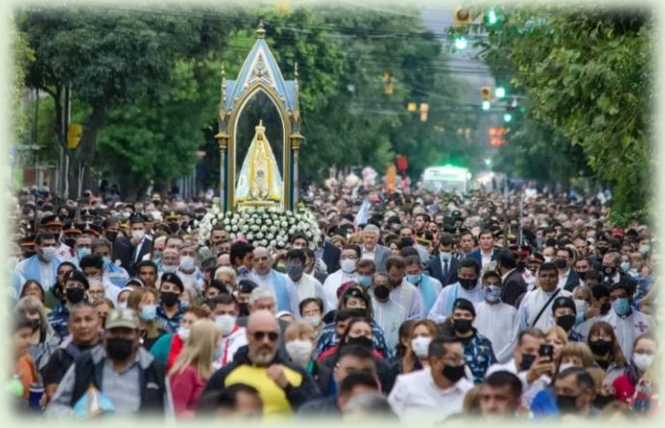
Procesión de Nuestra Señora del Valle