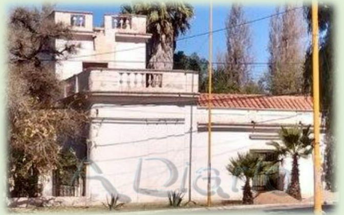
Casona de José Pío Cisneros