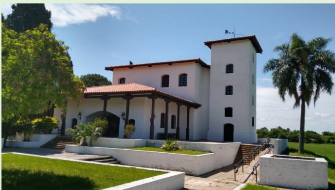
Parque Arqueológico Santa Fe La Vieja

La Fiesta Provincial de la Doma , en Noviembre, es otro espacio para celebrar las tradiciones ligadas a la vida en la ruralidad. Cobra especial relevancia porque en este evento se dan cita los mejores jinetes de la Provincia de Santa Fe, y se elige la delegación que la representará en el Festival de Doma y Folclore de Jesús María.