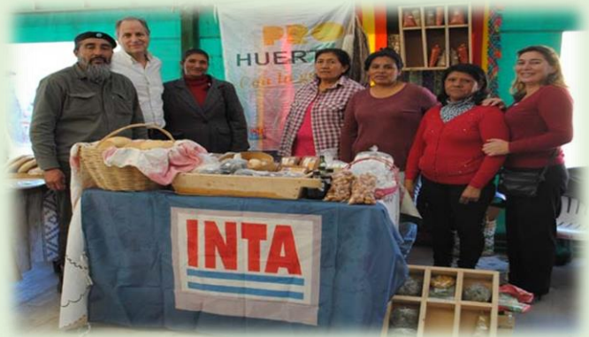
Expo Cerros y Puna