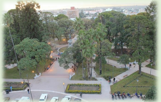
Plaza 25 de Mayo