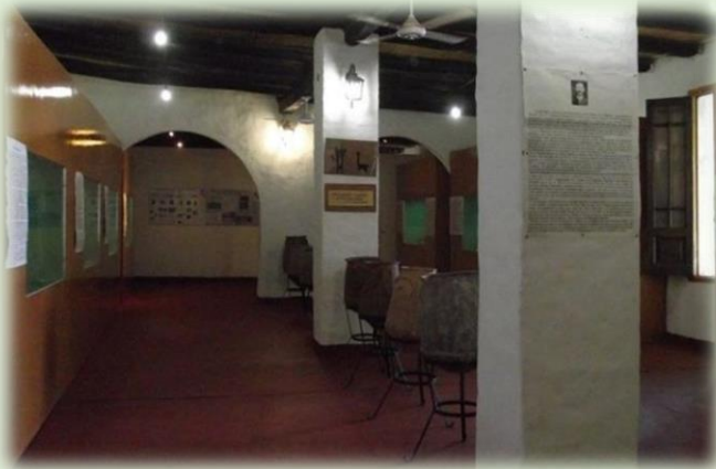
Museo Arqueológico Provincial Eric Boman