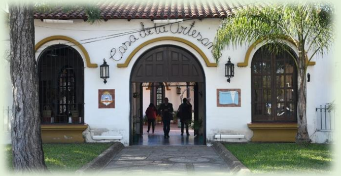
Ciudad de Formosa Casa de la Artesanía