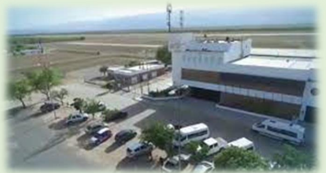
Aeropuerto Internacional Coronel Felipe Varela