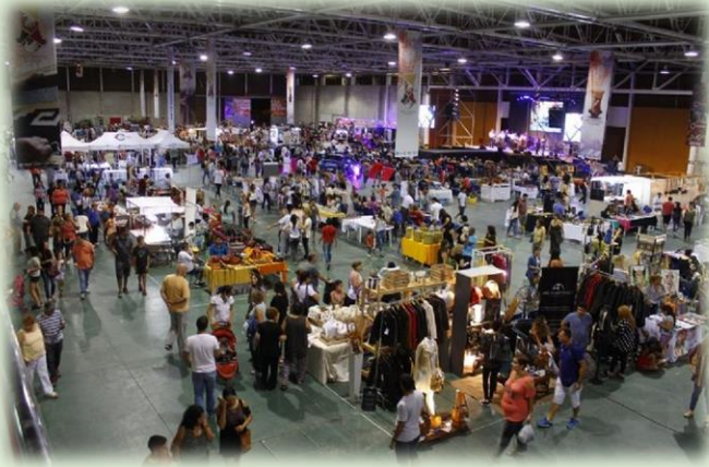
Feria Manos Catamarqueñas