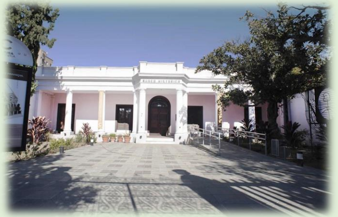
Museo Histórico Catamarca