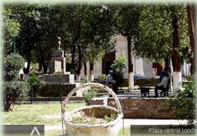
Plaza Hipólito Irigoyen

El evento destacado que celebra Londres es el Festival Provincial de la Nuez . Tierra de nogales, en Londres la producción de nueces es abundante, y es por esto que en Enero se comparte con los habitantes de la región la celebración al fruto del trabajo que realizan durante todo el año, y se cosecha durante el verano. Artistas nacionales y locales se dan cita en los festejos, para sumarse a los lugareños.