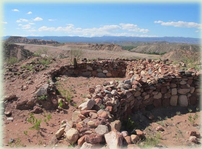
Pucará de Hualfín