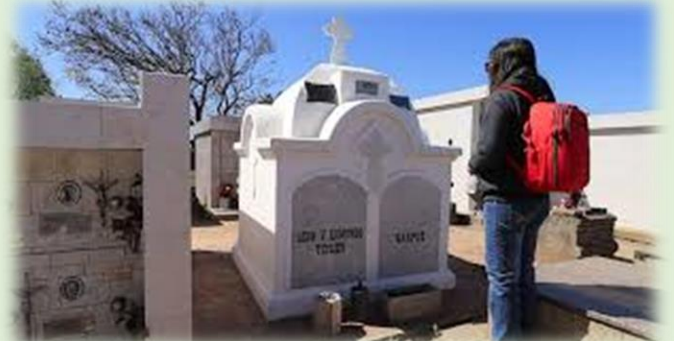
Cementerio de Cayastá Tumba de condes de Tessières – Boisbertrand