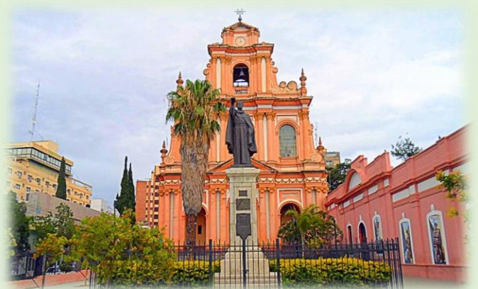
Templo de San Francisco