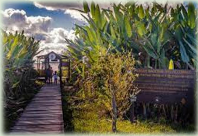
Parque Nacional Río Pilcomayo Estero Poí