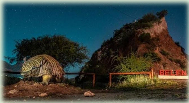
Quebrada de Belén

Festival Cuna del Poncho , en Julio, es el mayor evento de la localidad, ya que pone en relieve el producto del trabajo que durante todo el año desarrollan los artesanos de la zona, con estas prendas exclusivas, que son exhibidas con orgullo, junto a actividades musicales que, sobre el escenario, convocan a bandas de diferentes géneros y que tienen renombre a nivel nacional e internacional.