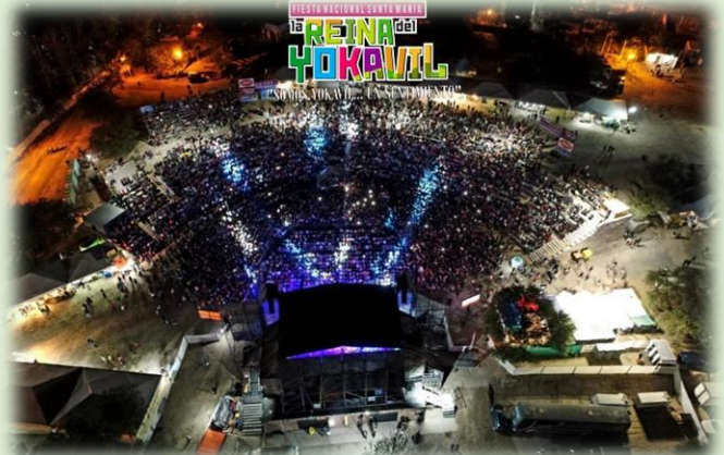
Fiesta Nacional Santa María la Reina del Yokavil