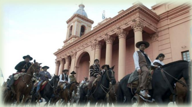
Cabalgata de los Gauchos en honor a la Virgen del Valle