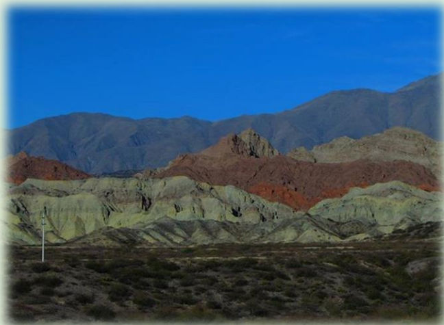
Cerro de Colores