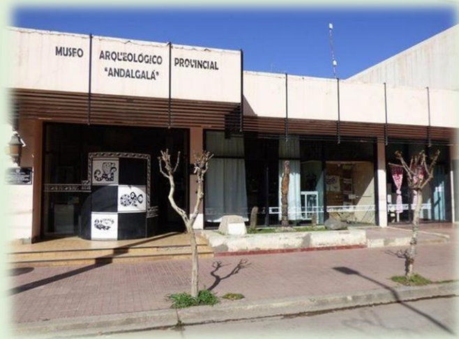
Museo Arqueológico Lafone Quevedo

Una vez al año, Andalgalá se viste de fiesta para celebrar el Festival el Fuerte de Andalgalá , que en Enero convoca a artistas nacionales y locales para celebrar la varias veces centenaria vida de esta población, nacida a los pies del Aconquija, y que atesora una rica historia, con tradiciones y bellezas naturales que merecen ser conocidas.