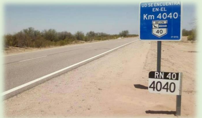
Kilómetro 4040 de la Ruta Nacional 40