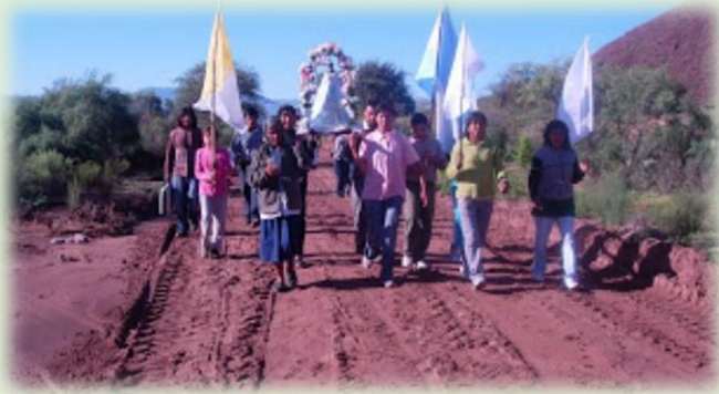
Fiestas Patronales de Nuestra Señora del Rosario