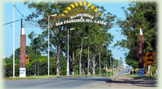
Misión San Francisco de Laishí