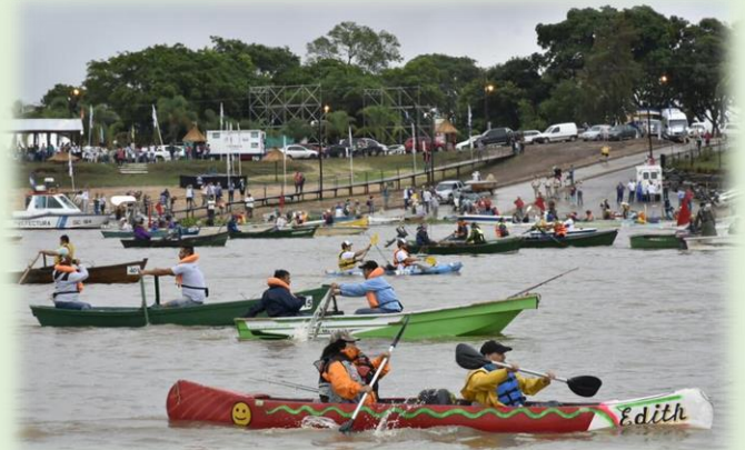
Fiesta Nacional de la Corvina de Río