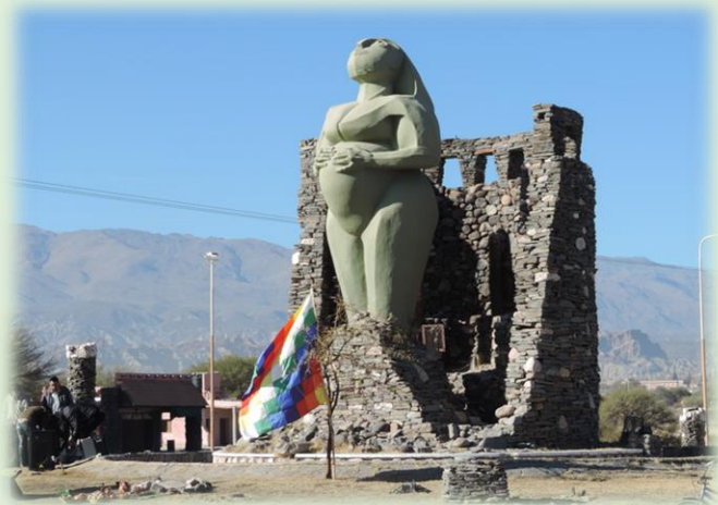
Homenaje a la Pachamama