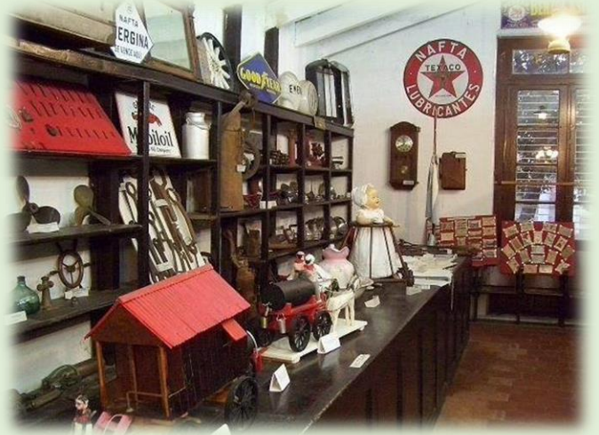
Museo del Recuerdo