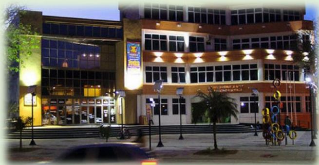
Ciudad de Formosa Teatro de la Ciudad