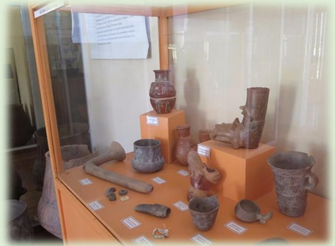
Museo Arqueológico Condor Huasi