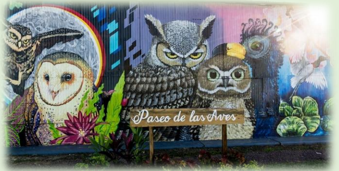
Ciudad de Formosa Paseo Ferroviario