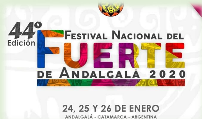
Festival el Fuerte de Andalgalá