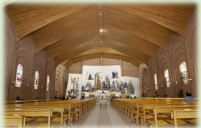
Templo de Nuestra Señora de la Candelaria