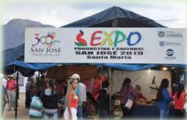
Expo Productiva y Cultural San José