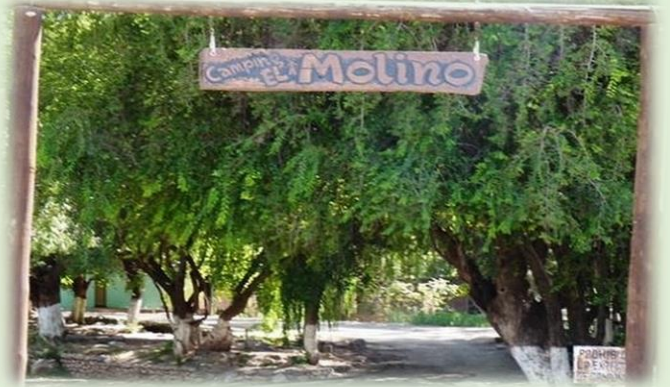
Camping Municipal El Molino