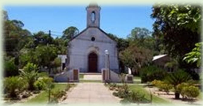
Parroquia Natividad de la Virgen