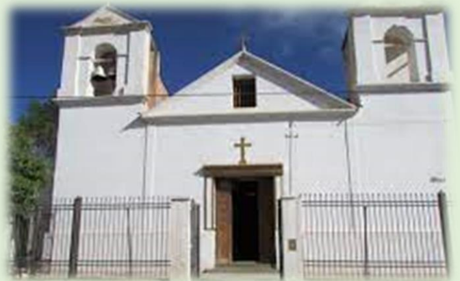
Iglesia de la Inmaculada Concepción