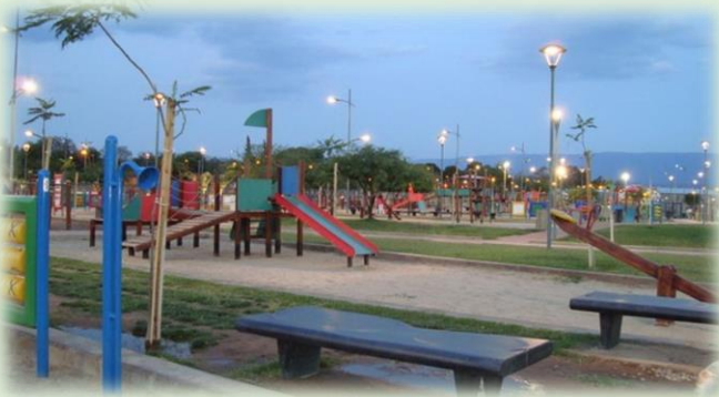
Parque de los Niños