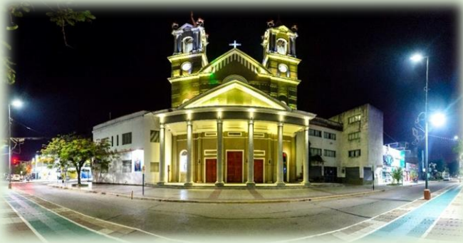
Ciudad de Formosa Iglesia Catedral Nuestra Señora del Carmen