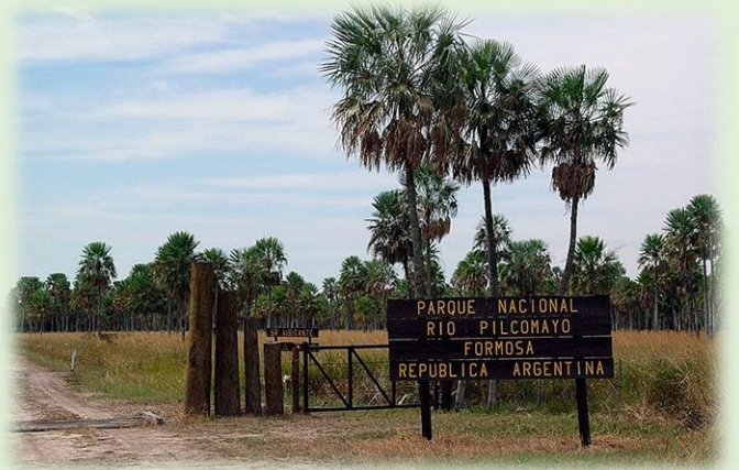
Parque Nacional Río Pilcomayo