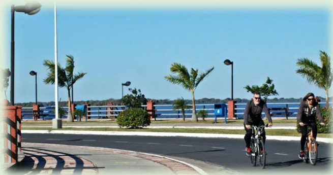
Ciudad de Formosa Costanera Vuelta Formosa

Más información http://www.formosahermosa.gob.ar/region-sur/el-colorado/