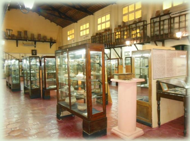
Museo Arqueológico Adán Quiroga