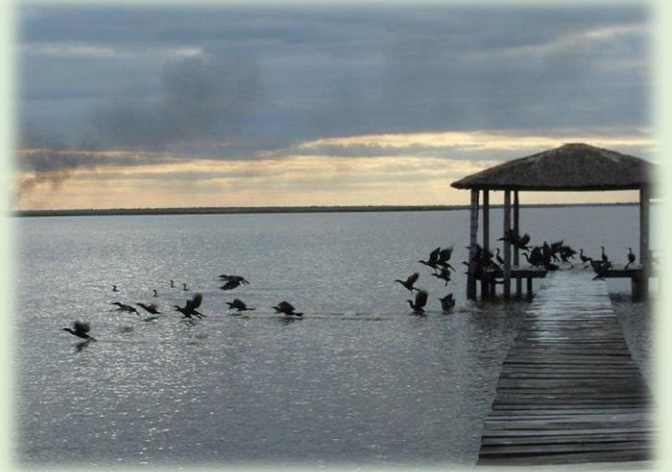
Parque Nacional Río Pilcomayo Laguna Blanca