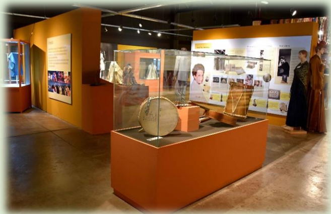
Museo de la Fiesta Nacional del Poncho