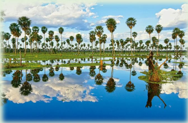
Bañado La Estrella