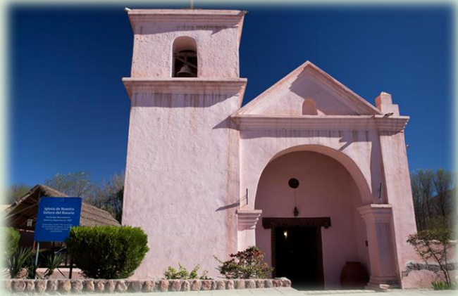
Capilla de Nuestra Señora del Rosario

Festival del Minero , en Diciembre, se desarrolla en Los Nacimientos