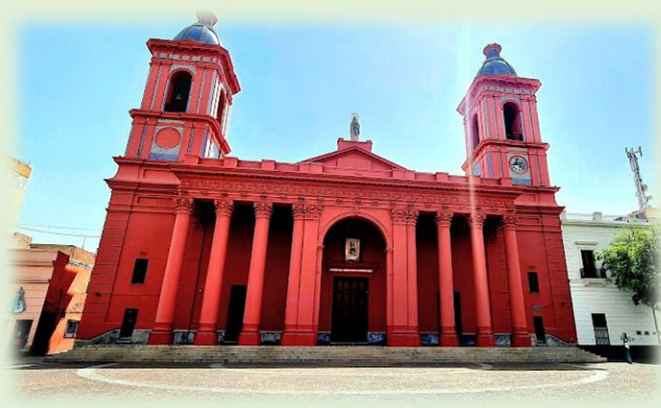
Catedral Basílica Nuestra Señora del Valle

Fiesta Nacional e Internacional del Poncho , es uno de los mayores eventos del interior del país. Julio es el mes elegido para llevar a cabo este encuentro, que congrega a los artesanos más reconocidos en este arte ancestral, que produce piezas que llegan al mundo, a partir de la habilidad que las tejedoras y tejedores han adquirido desde épocas ancestrales. A la exposición propiamente dicha, se suma un espacio gastronómico muy amplio, y la cartelera artística encuentra a los exponentes de los géneros más diversos.