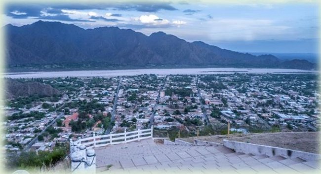
Mirador del cerro San Luis