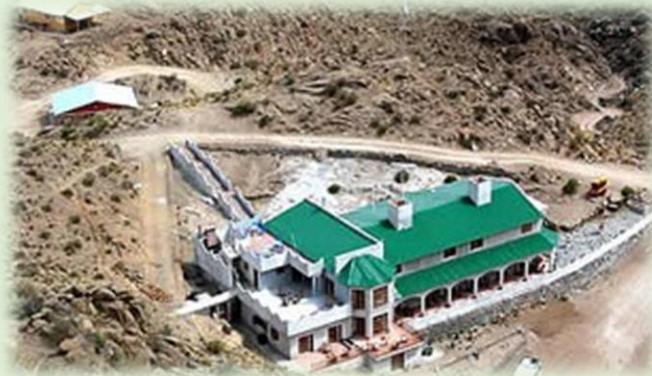
El Refugio del Minero