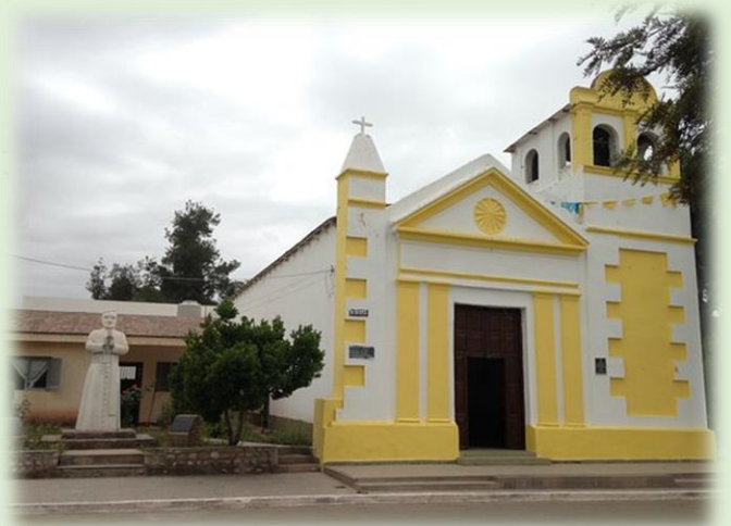
Parroquia San Juan Bautista