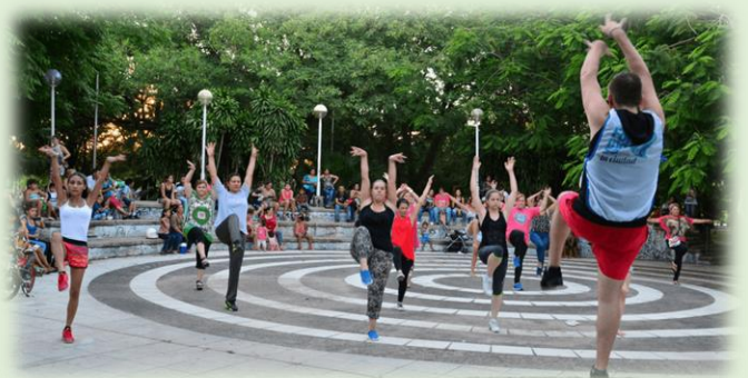
Ciudad de Formosa Plaza General San Martín