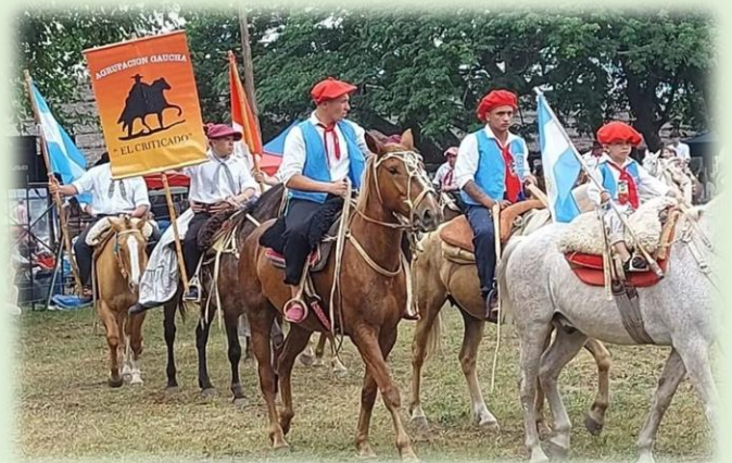
Fiesta Provincial de la Doma