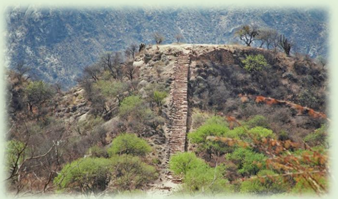
Shincal de Quimivil