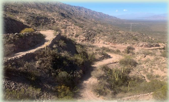
Cuesta de Zapata