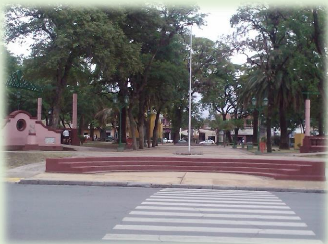
Plaza Eusebio Colombres