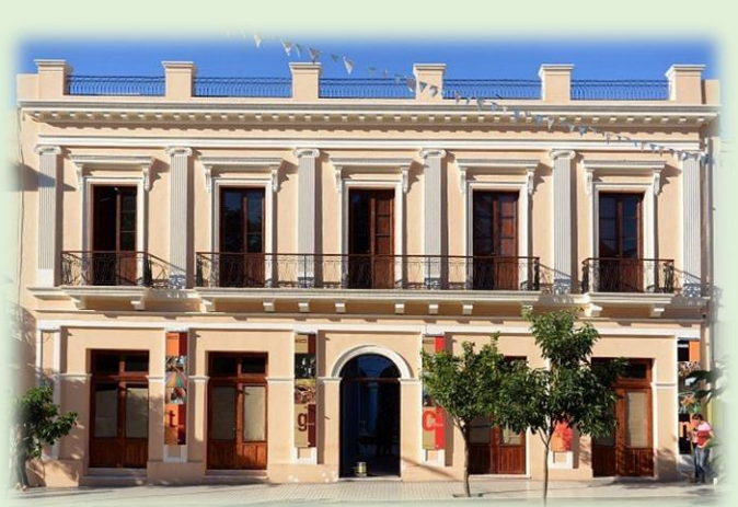
Museo de la Ciudad Luis Caravatti