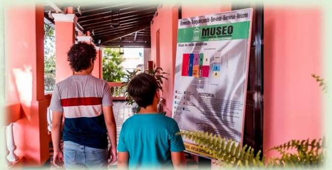
Ciudad de Formosa Museo Histórico Juan Pablo Duffard