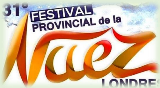
Festival Provincial de la Nuez