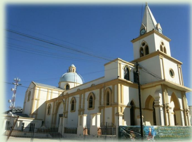
Templo de San Francisco