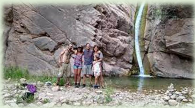
El Chorro de las Flores Amarillas