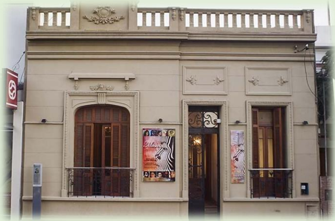
Museo de Bellas Artes Laureano Brizuela