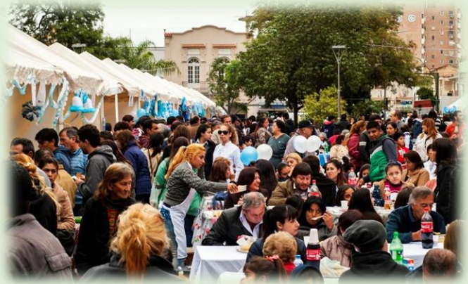
Fiesta Municipal del Loco