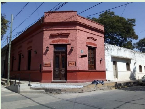
Museo de la Costa