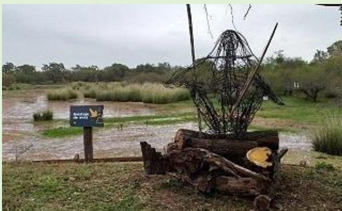
Planta Campamental Aula Verde