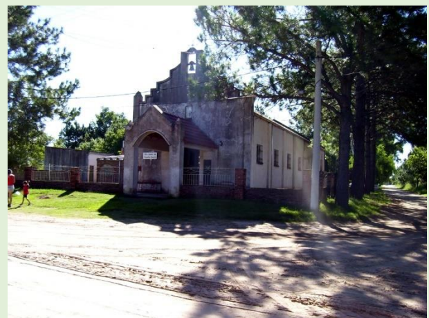
Capilla Nuestra Señora del Perpetuo Socorro Ruta Provincial 1 km 12,5 Calle Santa Rosa esq. calle 28