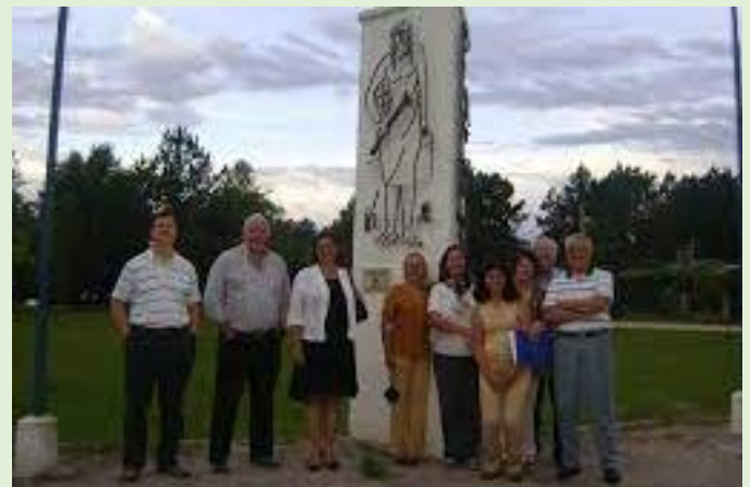
Plazoleta Paul Harris