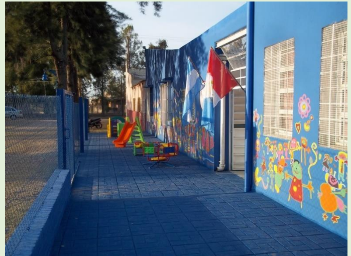
Jardín de Infantes 281 Mburucuyá Ruta Provincial 1 km 12,5 Calle Santa Rosa esq. Leandro N. Alem