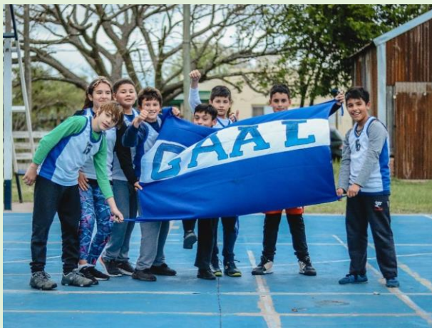
Club Atlético Arroyo Leyes Ruta Provincial 1 km 12,5 Calle Ocampo – 600m al Este