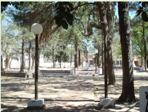
Plaza Brigadier Estanislao López

Con una extensión de 7 kilómetros, su trazado de tierra nace en San José del Rincón, en su intersección con calle Juan de Garay, y desde allí se dirige hacia el Norte, con el paso por lugares emblemáticos de Rincón, como lo son la plaza Brigadier General Estanislao López , la Parroquia Nuestra Señora del Carmen , el Museo de la Costa o el Club Central San José del Rincón .