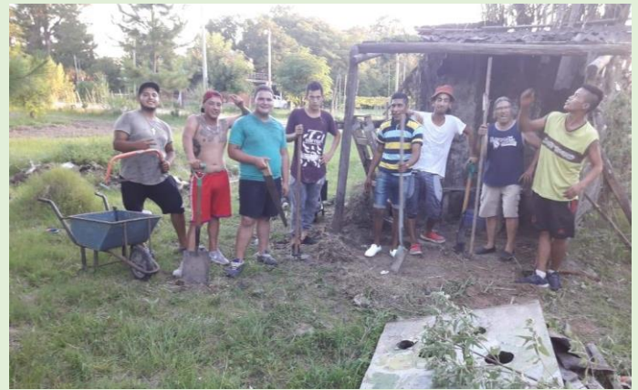
Asociación Civil El Baldío Ruta Provincial 1 km 10,5 Calle 10 – 800m al Este