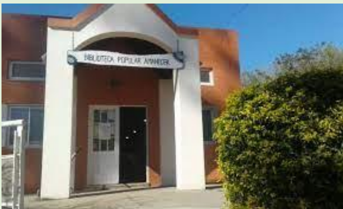
Biblioteca Popular Amanecer Ruta Provincial 1 km 13,5 Esq. calle 60