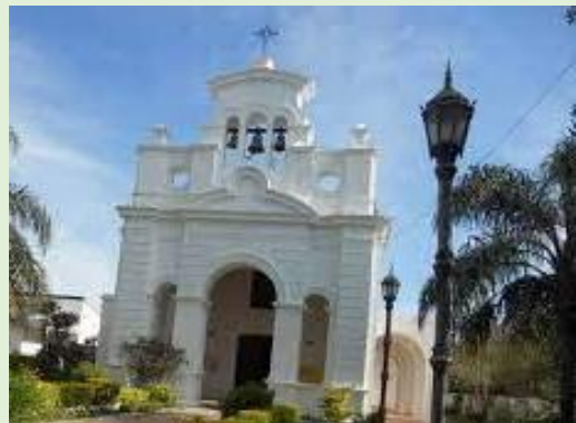
Parroquia Nuestra Señora del Carmen