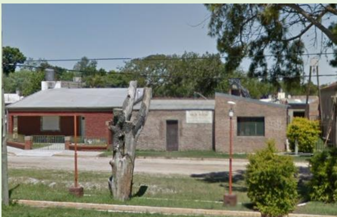
Centro de Salud Rincón Potrero Ruta Provincial 1 km 19 Esq. calle 112