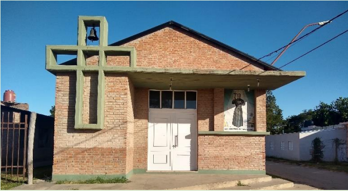
Capilla San Eugenio Mazenod Ruta Provincial 1 km 19 Esq. calle 112