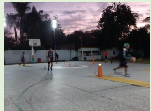
Club Central Rincón