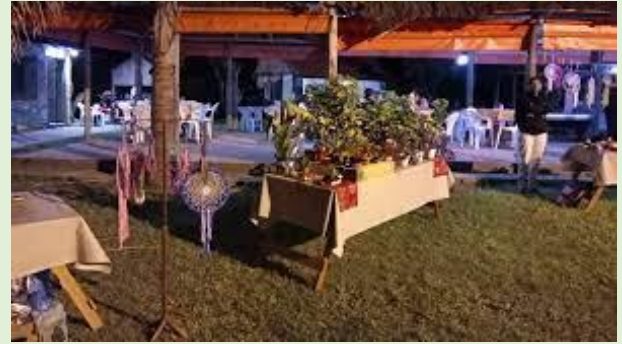
Feria Artesanos y Emprendedores Arroyo Leyes Ruta Provincial 1 km 12,5 Entre calles 24 y 28