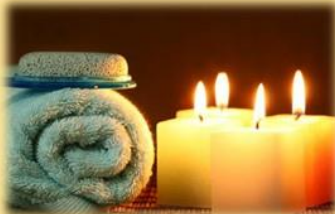
Spa / Masajes / Reiki