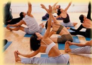
Clases de Yoga: Lunes, Miércoles y Viernes 9 hs. / 18 hs. / 20 hs.