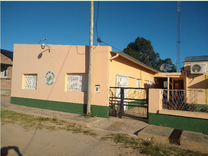
Escuela Primaria 41 Domingo F. Sarmiento Ruta Provincial 1 km 19 Esq. calle 112