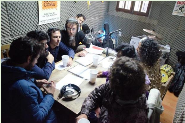
Radio Voces de la Costa Ruta Provincial 1 km 16,5 Calle 90 – 280m al Este