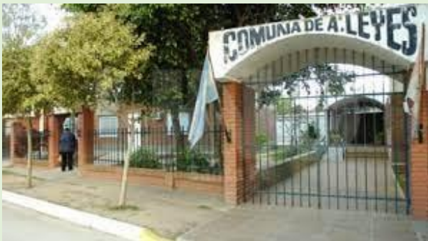
Comuna de Arroyo Leyes Ruta Provincial 1 km 12,5 Entre calles 24 y 28

A continuación, ofrecemos un breve recorrido en imágenes de las instituciones que marcaron el nacimiento de Arroyo Leyes como localidad, y que diagramarán el futuro de este pueblo aún joven, pero con un largo camino recorrido en su historia.