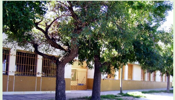
Escuela Primaria 30 Domingo Guzmán Silva Ruta Provincial 1 km 12,5 Calle Santa Rosa esq. Leandro N. Alem