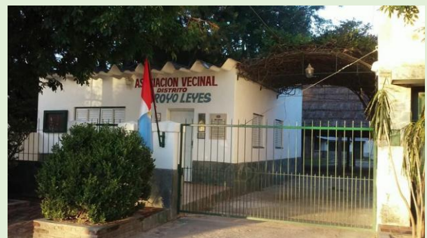
Asociación Vecinal Arroyo Leyes Ruta Provincial km 14,5 Calle 70 – 50m al Este