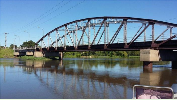
Puente de Hierro