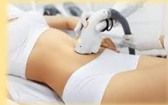
Aparatología Cosmeatría general