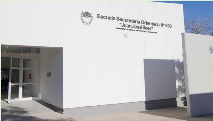
Escuela Secundaria 590 Juan José Saer Ruta Provincial 1 km 12,5 Calle Santa Rosa esq. Leandro N. Alem