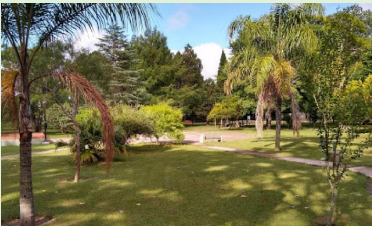
Plaza San Martín