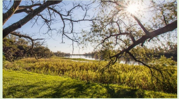
Reserva Natural Los Ceibos

Ya en el casco urbano de la localidad, estos sitios son espacios verdes preparados para recibir la visita de quienes quieran hacer un alto en el recorrido, y que invitan al descanso: