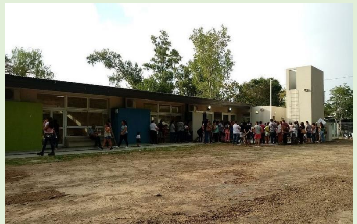
Jardín Maternal Retoños Costeros Ruta Provincial 1 km 13,5 Calle 60 esq. calle 55