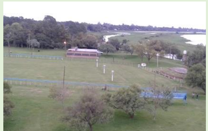
Camping Comunal Los Naranjos